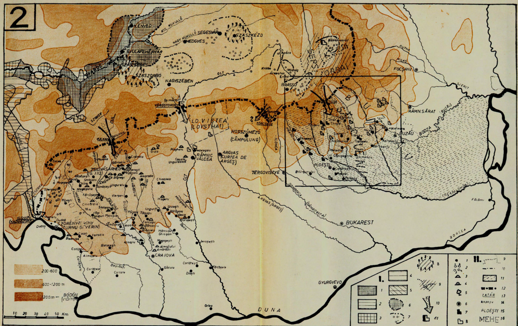
A középkori magyarság kitepedése a Déli-Kárpáton s nyomai Szörénységben és Havaselvén.