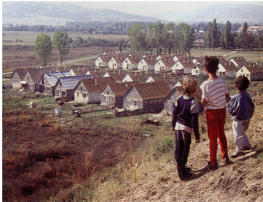
A csökkent értékű lakások (Cs-lakás) területén a régies és szegényes formák újraéledését tapasztalhatjuk (Bódi László felvétele, Sajókaza, 1992)

Korunk fájdalmas ellentmondása, hogy miközben a cigányok etnikai csoportjai közötti kulturális integráció folyamata felgyorsult, a cigányság széles tömegei rohamosan elszegényednek, munkanélkülivé lesznek, s minden más