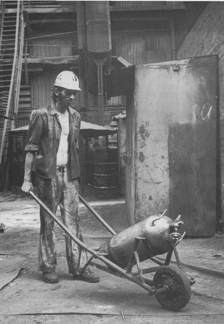
A cigányok élethelyzetében nagy változást jelentett a stabil munkahely (Ózd, 1970)