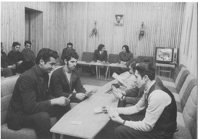
A szállási cigányok sorsuk felfelé ívelő folyamataként élik meg a munkásszállói létet (Az MTI jelenti, 1975)