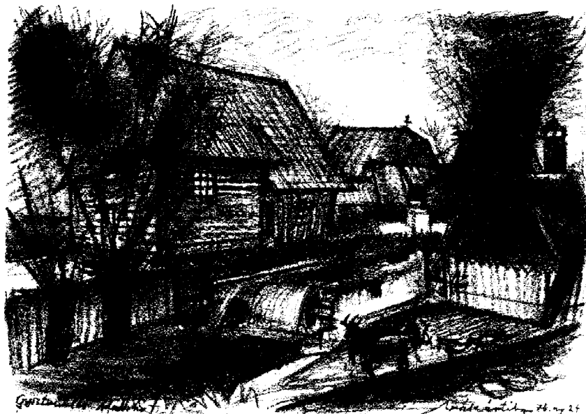
Malom a Békényen – Vákár Tibor rajza, 1974

Gyergyószentmiklóstól mintegy négy óra járásnyira a tó és hegyszoros együttese, lehatárolva a Gyilkos-havas fenyveseivel és a Kis-Cohárd vöröses színű roppant sziklatömbjével, olyannyira festői látvány, amelyen kevés akad az egész kárpáti térségben.