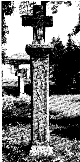
Kőkereszt a gyergyószentmiklósi örmény katolikus templom cintermében

Az erdélyi katolikusság bástyája ez a vidék; a gyergyói székelység megmaradt vagy viszontagságos hitküzdelmek után visszatért az anyaszentegyházba. Román őslakosság (eredetileg többségben görög katolikusok) Vaslábbon van, illetve a távoli hegyvidék két jelentősebb településén Tölgyesen, Békáson és azok vonzásterében él.