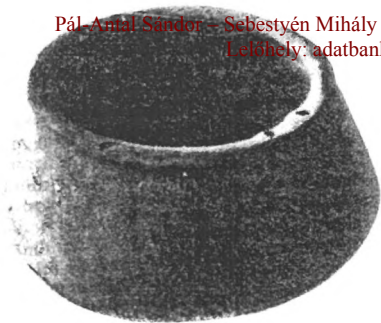
Árpád-kori cserépüst. (Ehhez, a Szeged környékén talált üsthöz hasonlíthatott a deményházi is.)

ve; míg a közszékelyek, páncélt, lándzsát, sisakot, csákányt vagy fjat és nyilat voltak kötelesek a lustrákra és a háborúba magukkal vinni. A székely haderő nagyságát a korabeli források általában 30–50 ezer közötti főre becsülték.