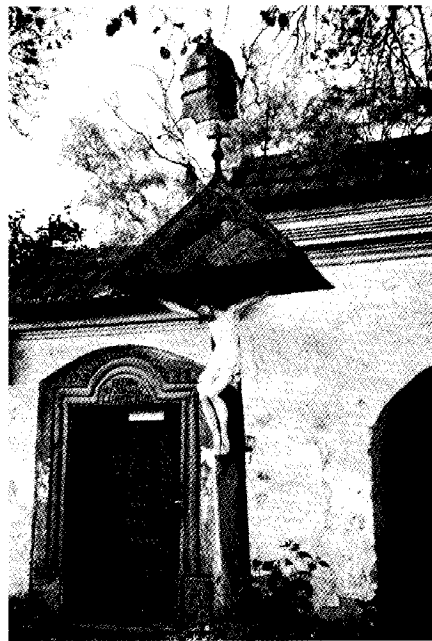
Feszület a gyergyószentmiklósi örmény katolikus templomnál

Mivel kőépületek, a szárhegyi kastély kivételével kezdetben csak templomok voltak, a kőfaragás az egyházművészet hez kapcsolódott. Helyi mesterek és idegenből jött kőfaragók-szobrászok működnek közre a vidék templomainak építésénél. Ők faragják a gótikus és barokk templomok architektúráis elemeit, bordázataikat, ajtó- és ablakkereteiket és szobordíszeket is. Ilyenek a ditrói régi („kicsi”) templom