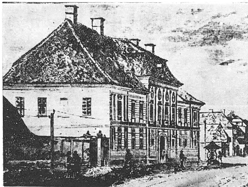
Curtea de Apel („Tabla regească“) din Tirgu-Mureș.