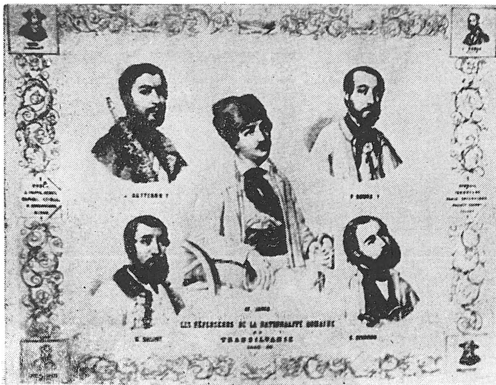
Avram Iancu și prefecții săi

nalilor și posibilitățile de emancipare a acestora. Cuvîntul lui Iancu, ponderat, de mare prestanță, atîrna serios în balanța discuțiilor. Ceea ce-l preocupă în primul rînd pe Iancu, era situația țăranilor iobagi români, dar deopotrivă a întregii comunități naționale. În 15 ianuarie 1847 a participat, împreună cu alți canceliști, la lucrările dietei feudale din Cluj, urmărind de la Galerie, cu înfrigurare, discuțiile pe marginea noului proiect de urbaniu, care urmărea să reglementeze raporturile agrare din Transilvania. Atitudinea lipsită de omenie a nobilimii l-a revoltat profund pe Avram Iancu. Iancu, relatează colegul și biograful său Iosif Sterca Șuluțiu, aflat atunci lîngă el, „care asculta cum se împărțesc domnii pe pielea bietului țăran, gemea ca un taur ferecat și tremura ca varga, o convulsione și nervozitate l-a cuprins, îl scuturau frigurile. A trebuit să-l duc cu sila de acolo, mă teamam că va face un scandal“. Pe drum, cătră casă, cînd Șuluțiu a încercat să-l liniștească, Iancu a rostit faimoasa sentință: „Nu cu argumente filosofice și umanitare vei putea convinge pe acei tirani, ci cu lancea, ca Horea“. Se contura așadar, poziția revoluționară a lui Avram