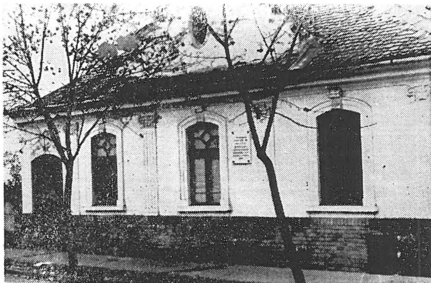
Casa în care a locuit Avram Iancu la Tirgu-Mureș în anii 1847—1848