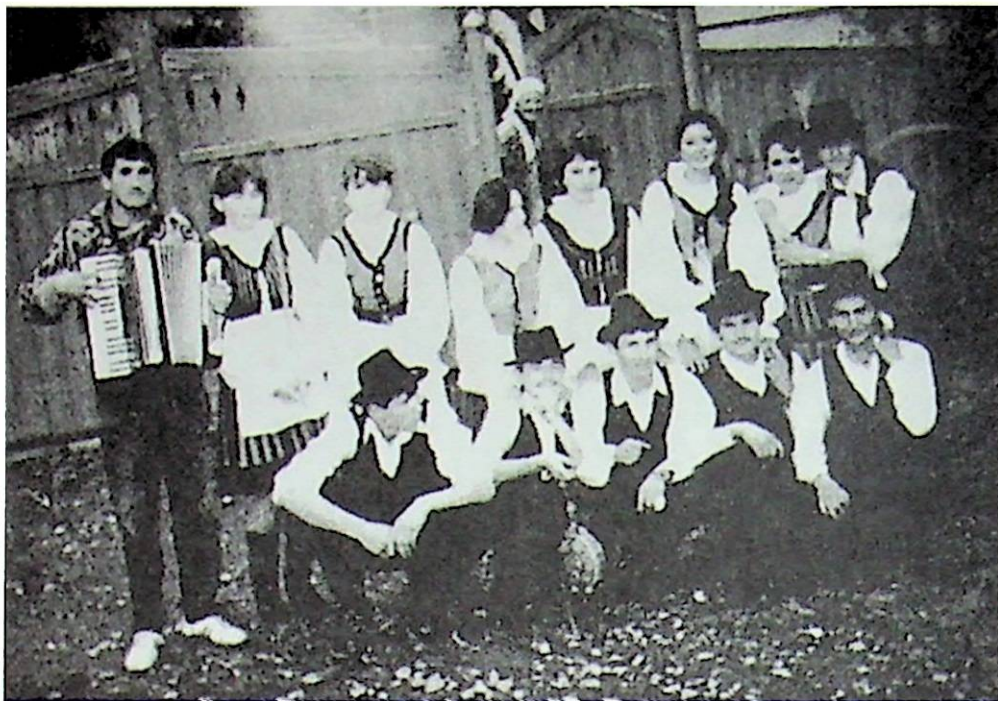
Papolci szüretelők 1995-ben