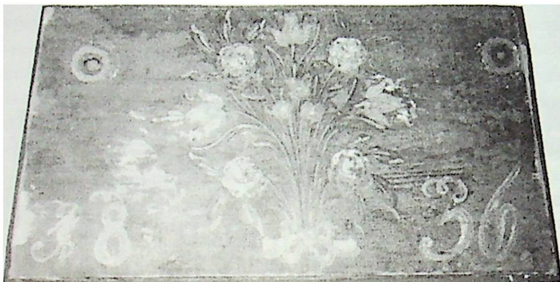
Festett láda (1856)