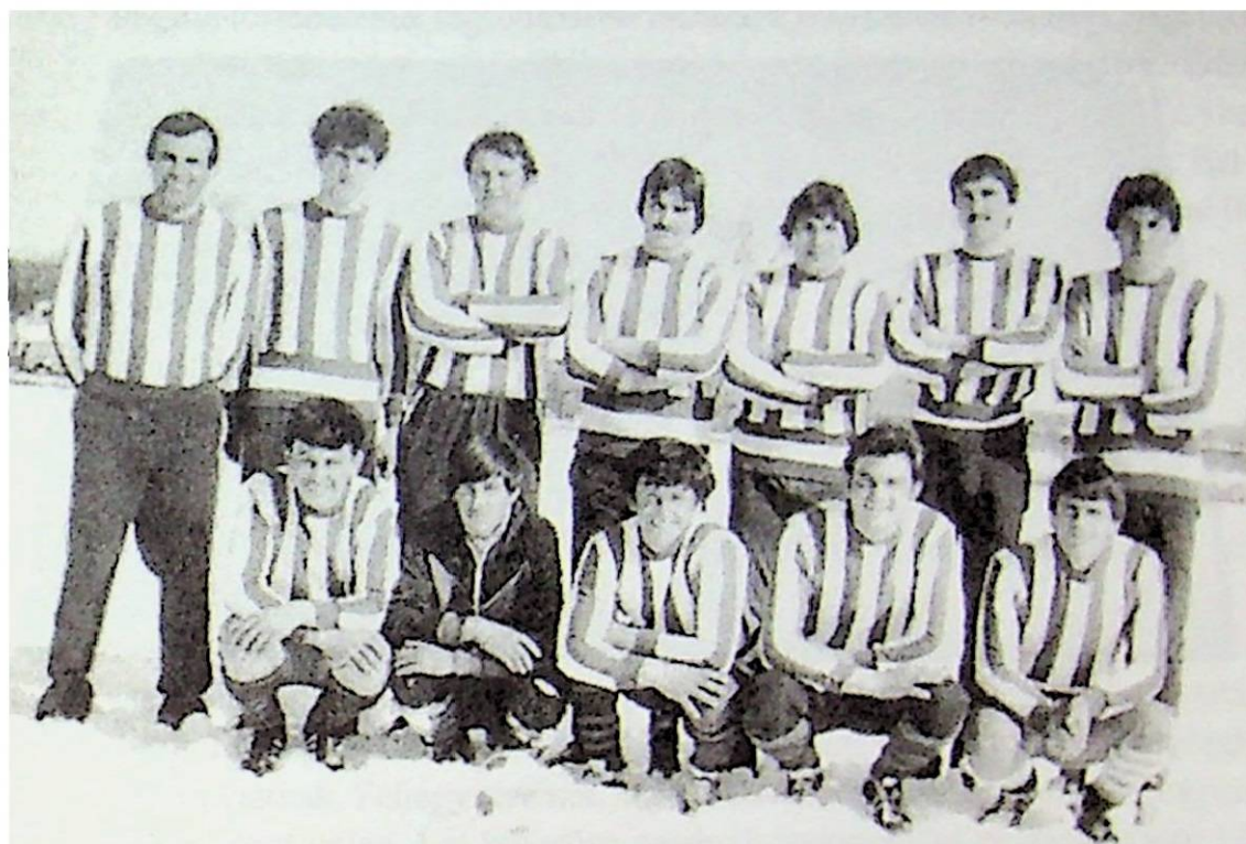
A papolci Vörös partizánok 1986-ban