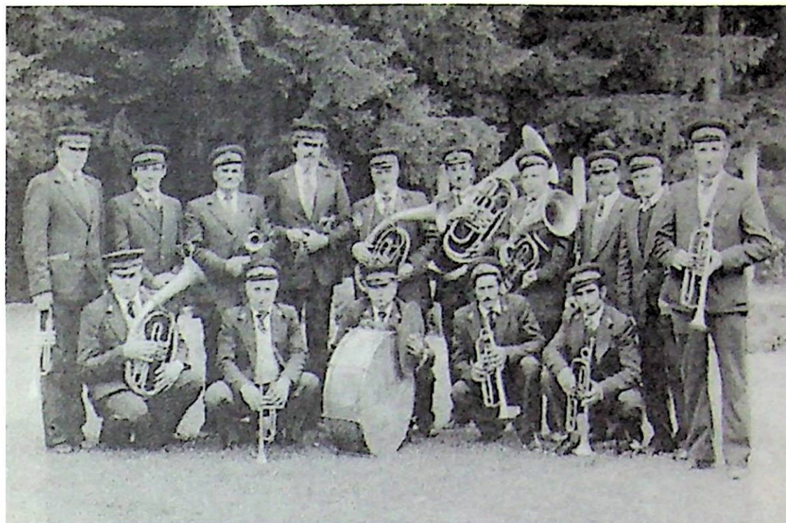
A papolci fúvószenekar 1984-ben