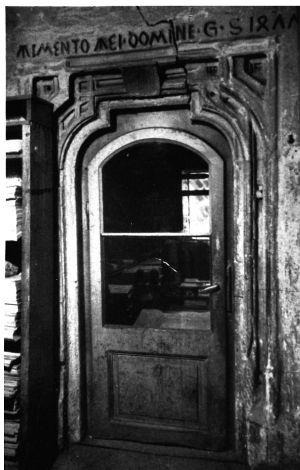
50. Kolozsvár, a plébániaház ajtaja. 1477.