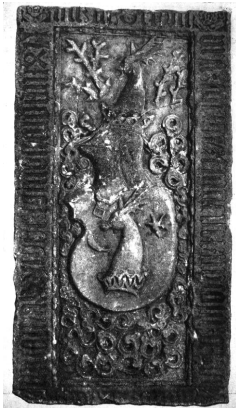
48. Mikola Ferenc és János sírköve. 1471. Kolozsvár, Erdélyi Nemzeti Múzeum.