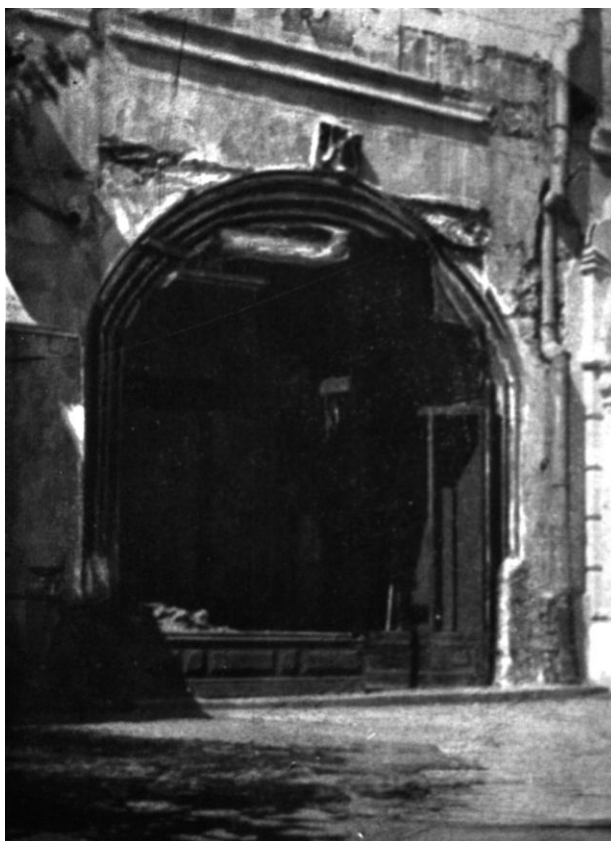
49. Kolozsvár, a plébániaház kapuja. 1477—1481 körül.