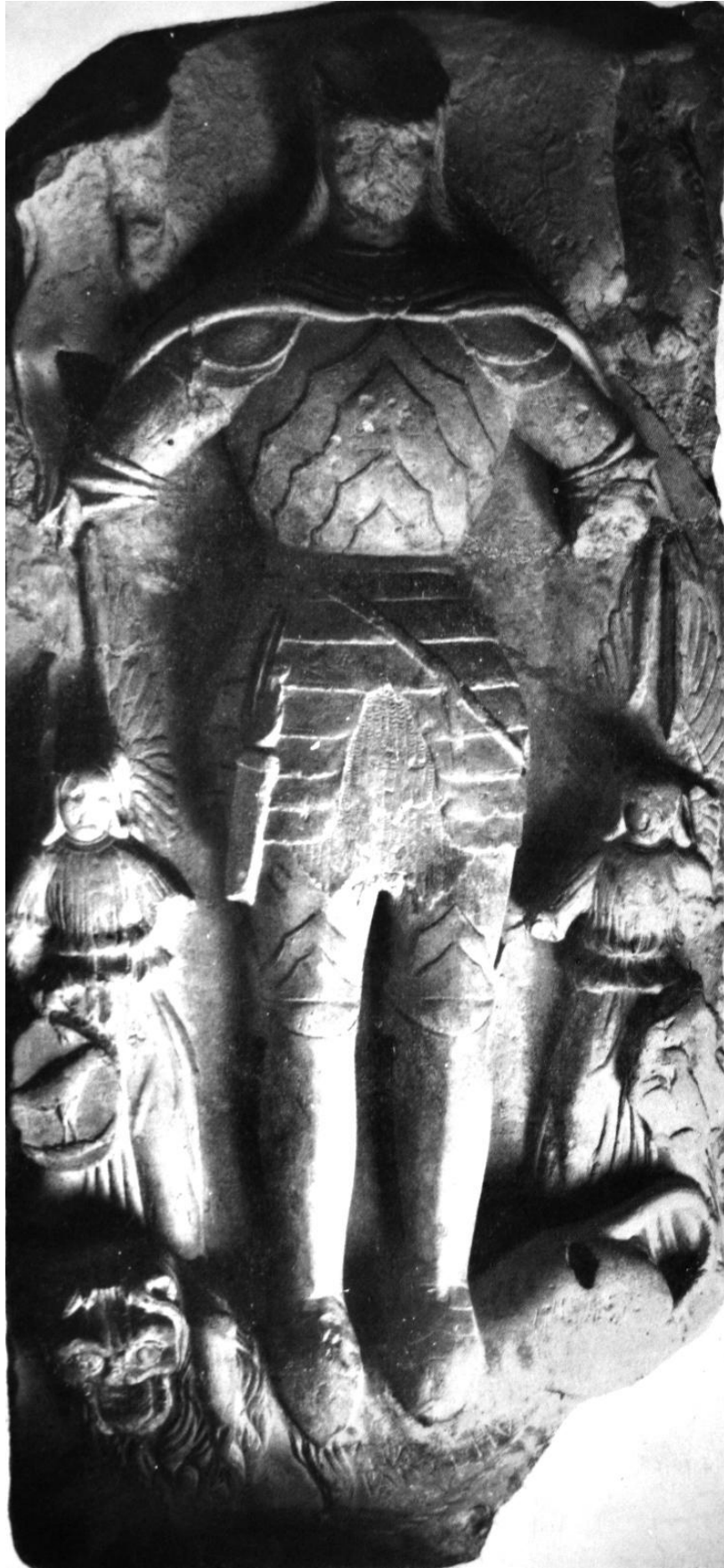
41. Hunyadi László (?) sírköve. 1460-as évek. Gyulafehérvár, székesegyház.