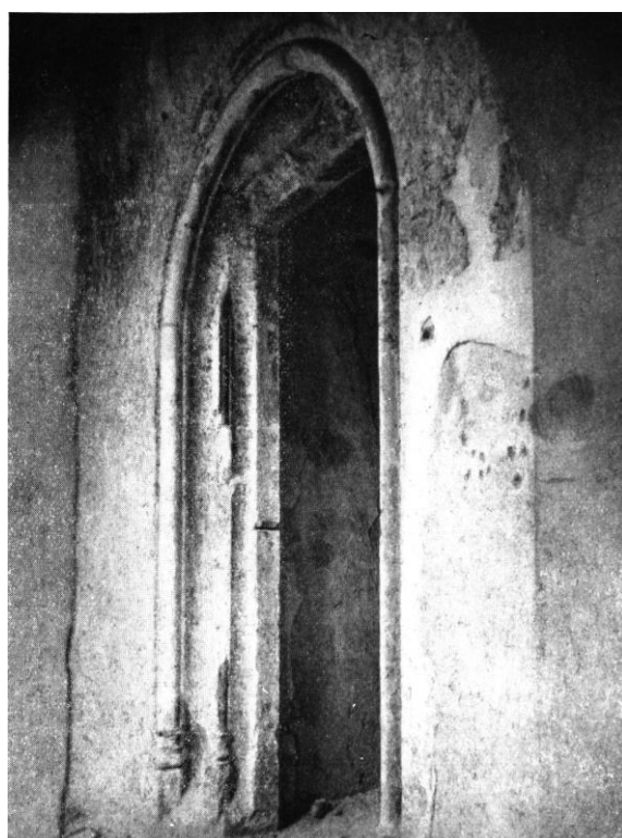
46. Vajdahunyad, a felső lovagterem egyik ajtaja. 1460—1482 között.