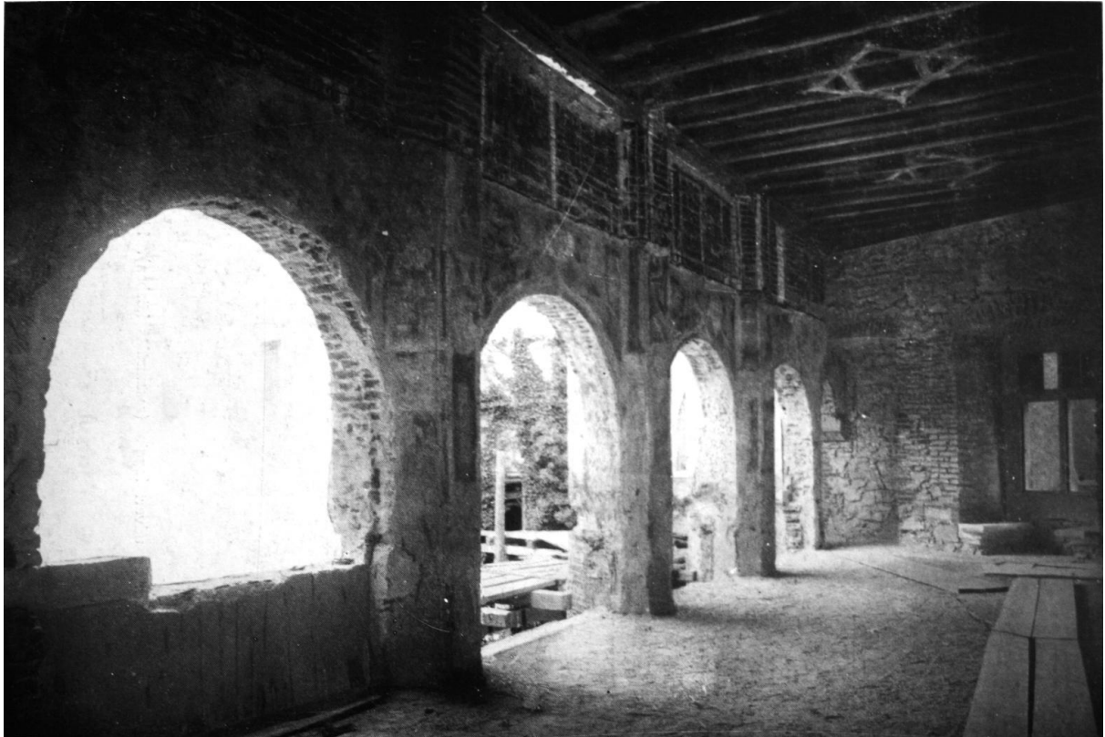
44. Vajdahunyad, az udvari loggia belülről (restaurálás közben). 1460—1482 között.