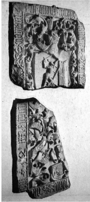
47. Tövisi Zay sírkő 1479. (gipszmásolat). Kolozsvár, Erdélyi Nemzeti Múzeum.