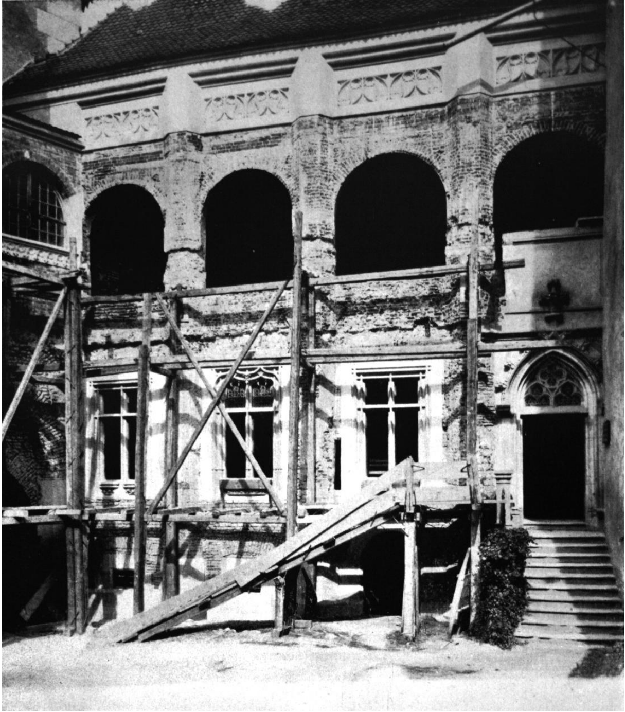
43. . Vajdahunyad, az udvari loggia (restaurálás közben). 1460—1482 között.