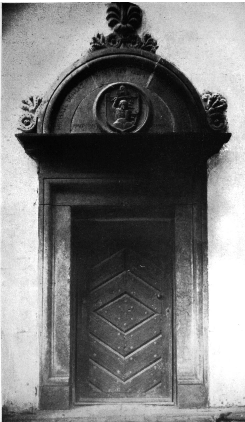
100. Menyő, ref. templom. Nyugati kapu. 1514. Ioannes Fiorentinus műve.