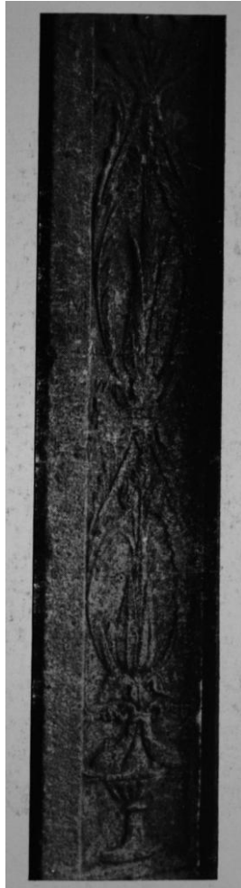
97. Gyulafehérvár, Lázói János kápolnája. Részlet a főkapu belső díszítéséből.