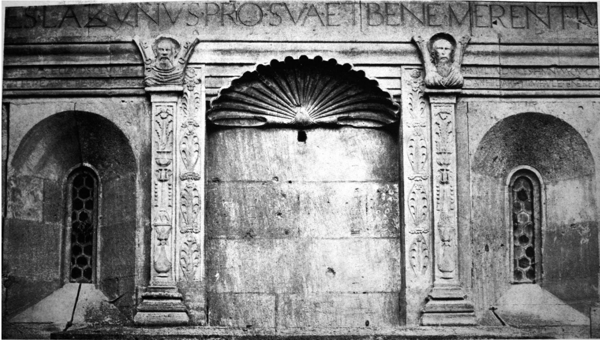
95. Gyulafehérvár, Lázói János kápolnája. Az északi homlokzat felső része.