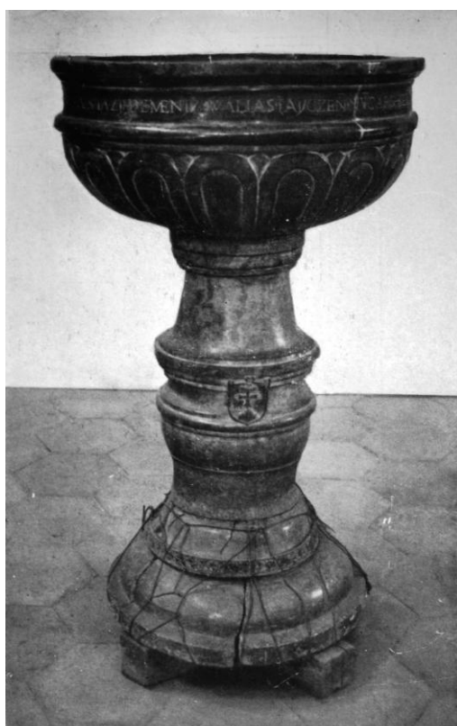
105. A menyői keresztelőmedence. 1515 Ioannes Fiorentinus műve. Nagyvárad, Múzeum.