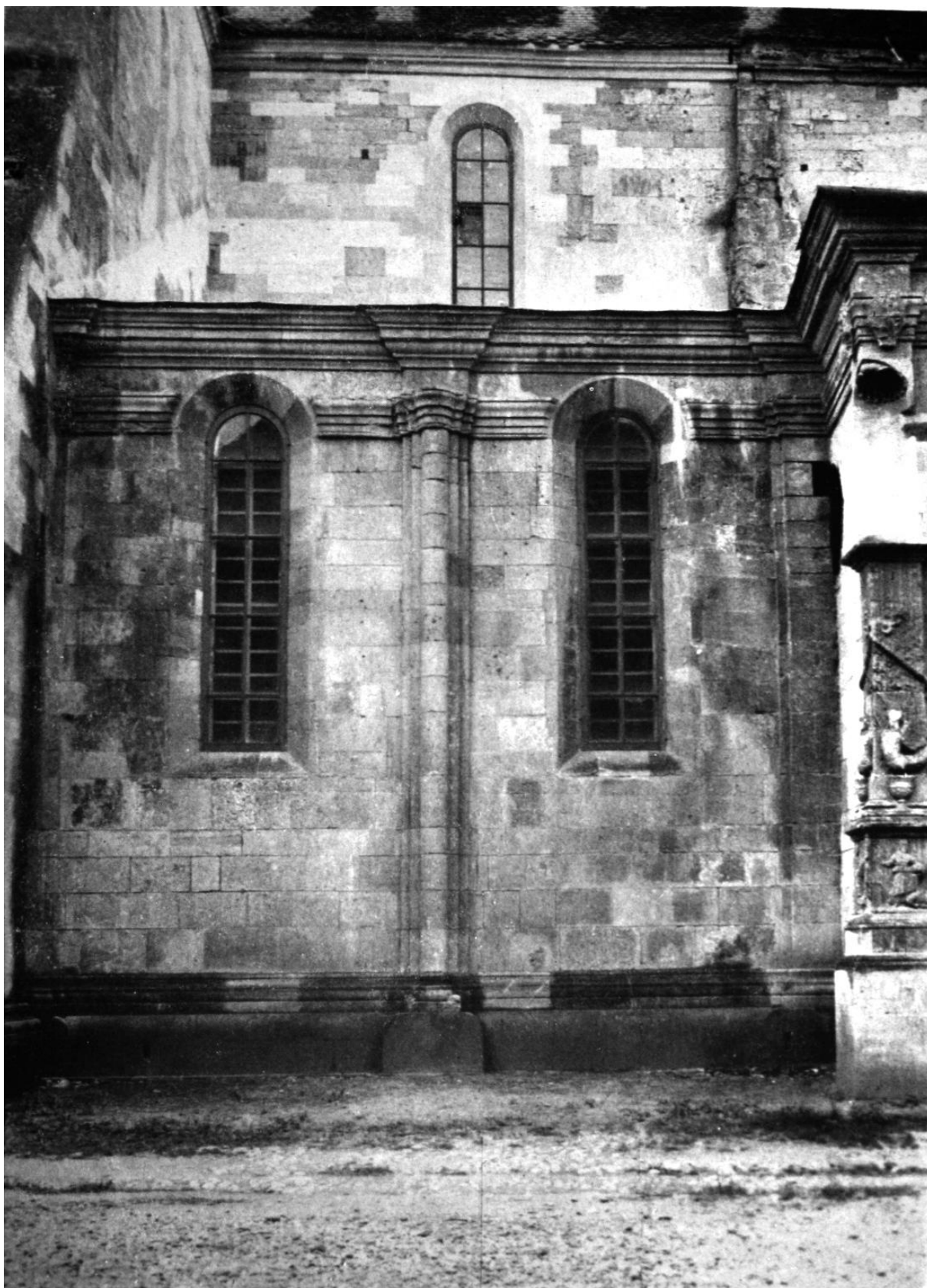
108. Gyulafehérvár, székesegyház. Várdy Ferenc püspök kápolnája. 1524 körül.