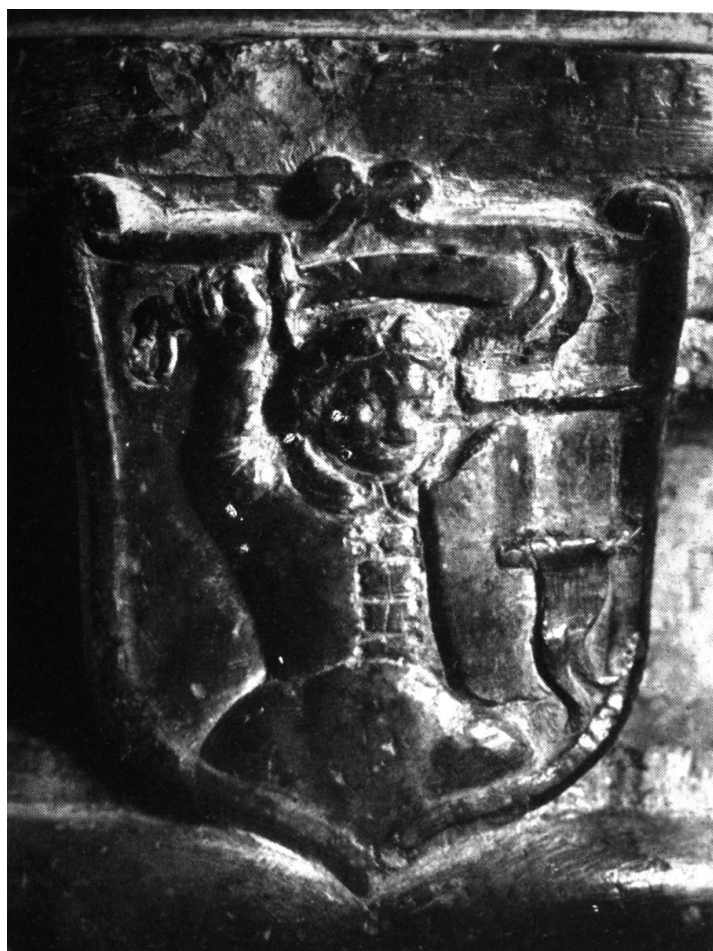
102. Désházy István címere a menyői keresztelőmedencéről.