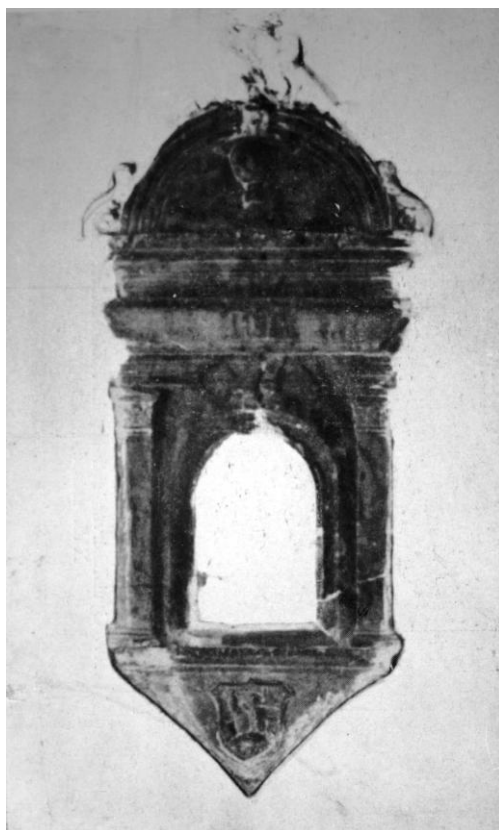
104. Menyő, ref. templom. Szentségtartó fülke. 1515. Ioannes Fiorentinus műve.