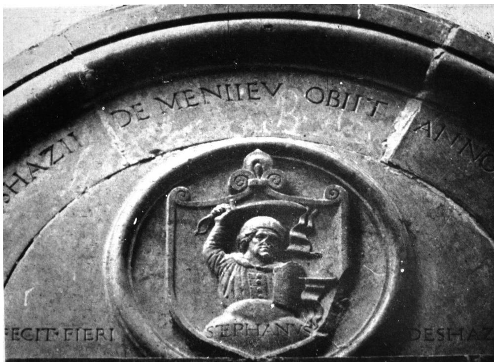
101. Désházy István címere a menyői kapuról.