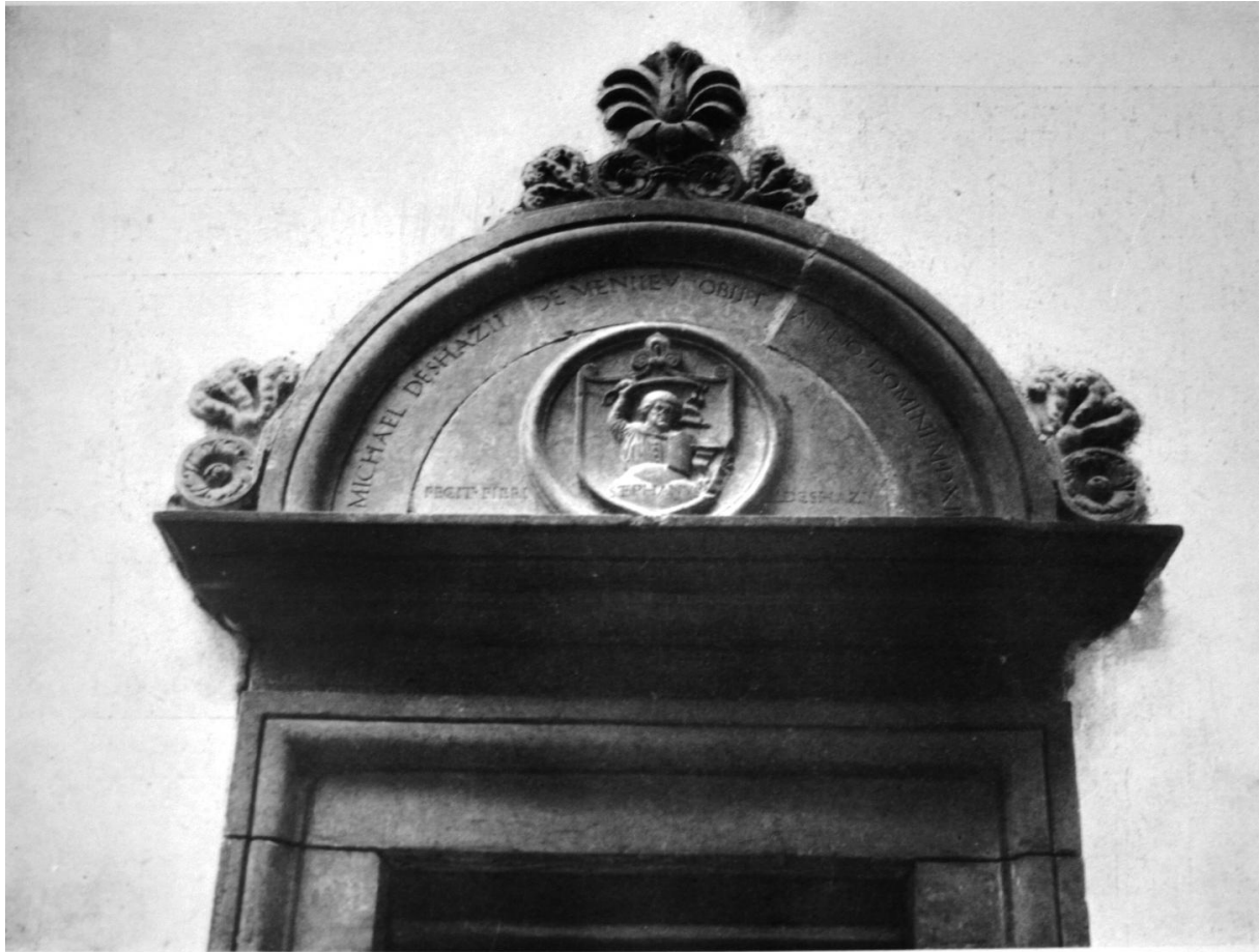
103. A menyői kapu oromzata.