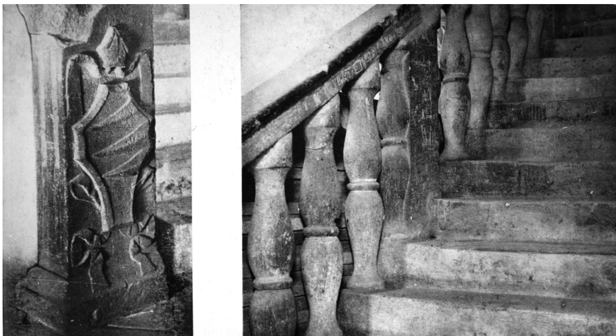
109—110. Gyulafehérvár, székesegyház. Lépcsőkorlát Várday Ferenc címerével. 1514—1524 között.