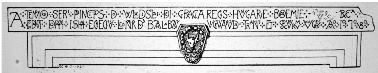
106. Héderfája, szemöldökkő Barlabássy Lénárd egykori kúriájából. 1508. Keöpeczi Sebestyén József rajza.