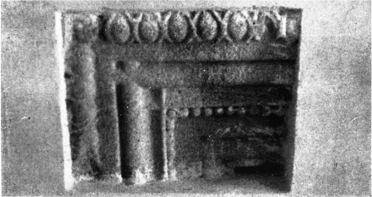
161. Marosvécs, vár. Ablakkeret töredéke. 1537 körül.