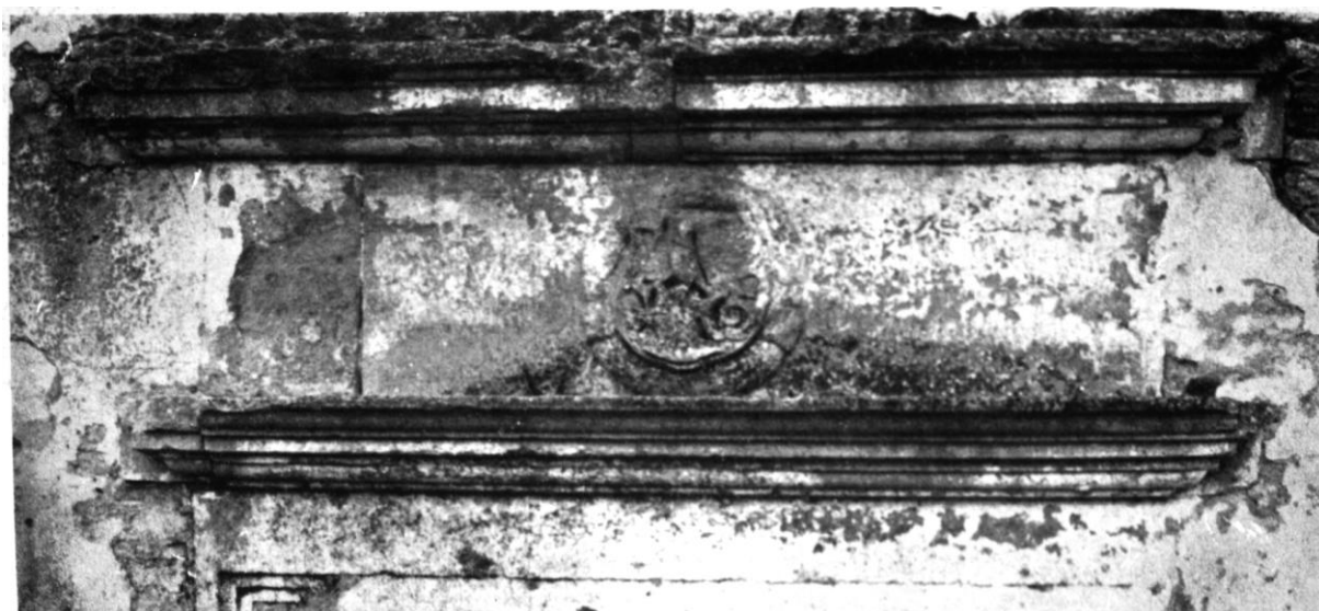
156. Kövesd, ref. templom. Nyugati kapu a kibontás előtt (részlet). 1535.