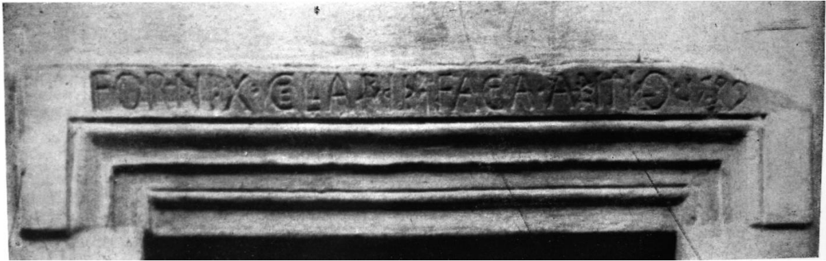
154. Kolozsvár, Szén-utca 6. Pinceajtó párkánya. 1539.