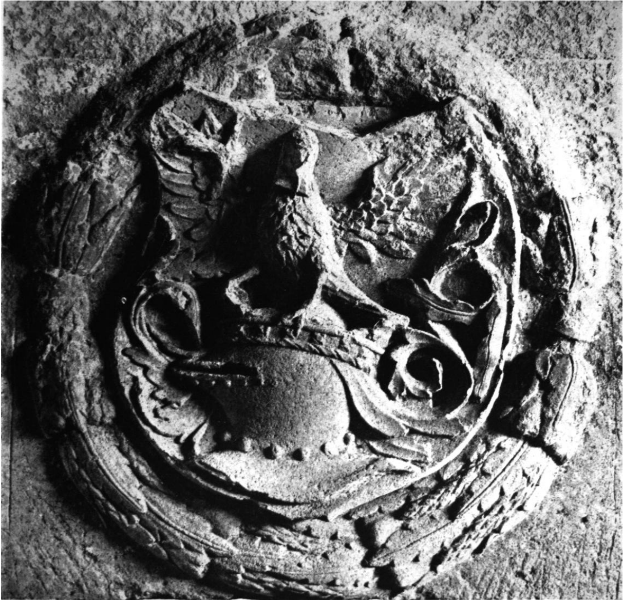
157. Csucsai Tomori Miklós címere a kövesdi kapu párkányán. 1535. Kolozsvár, Erdélyi Nemzeti Múzeum.