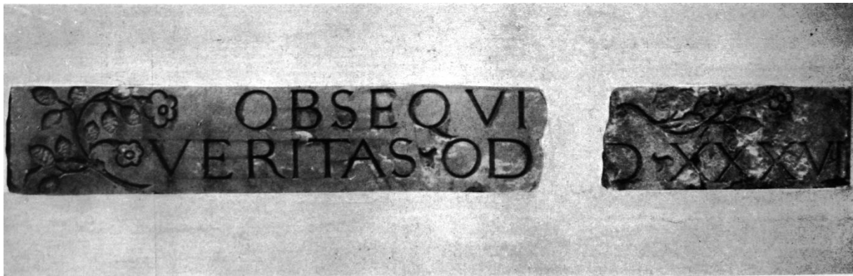
152. Kolozsvár, Mátyás király-tér 18. sz. Párkánytöredékek. 1536.