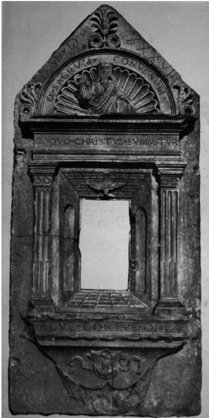
160. A kövesdi szentségtartó fülke, 1537. Kolozsvár, Erdélyi Nemzeti Múzeum.