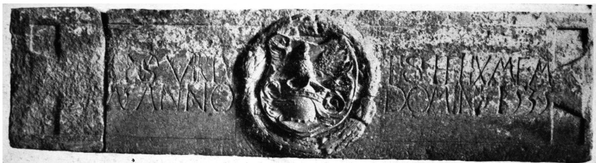
155. Kapupárkány a kövesdi ref. templomból. 1535. Kolozsvár, Erdélyi Nemzeti Múzeum.