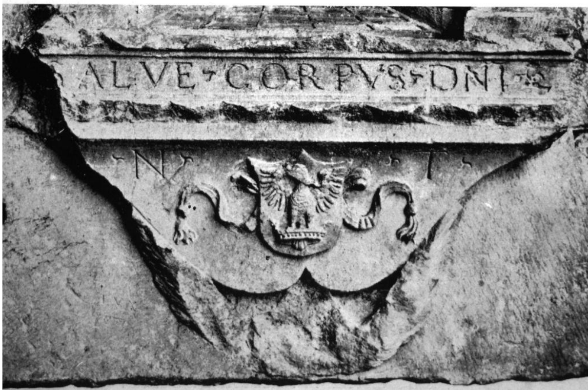
158–159. Részletek a kövesdi szentségtartó fülkéről. 1537. Kolozsvár, Erdélyi Nemzeti Múzeum.