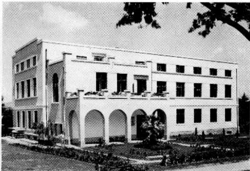
A növényteni intézet az új botanikus kertben A román megszállás alatt épült

egyetem volt magántanára is az orvosi kar megszervezésére vonatkozólag. Hangsúlyozta az erdélyi jelleg megtartásának szükségességét és a politikai küzdelmektől való óvakodás fontosságát.