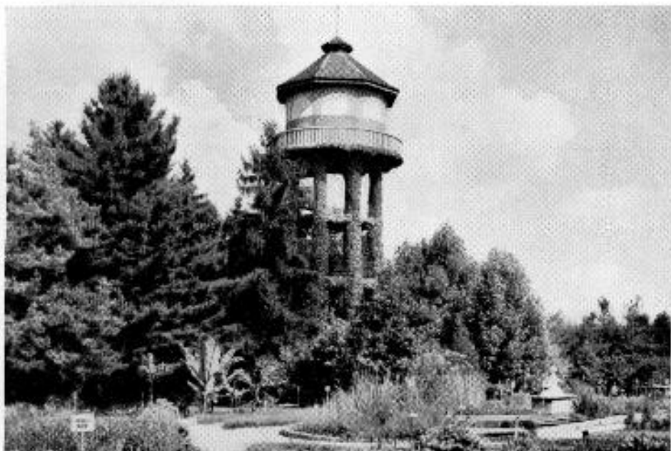
A magyar terv alapján a megszállás ideje alatt létesített egyetemi botanikus kert egyik részlete