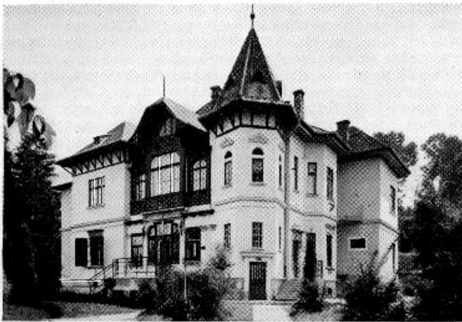
A filozófiai és a kísérleti lélektani intézet A román uralom alatt magán-villából átalakított épület

nagy száma nemhogy elősegítené, de egyenesen megakadályozza az egyetemi hallgató alapos felkészülését. Hogyan is lehetséges fizikailag, hogy egy fiatalember 30—40 előadásra járjon? A tanszékek száma nem felel meg a tudományos szükségletnek. Ez a szám szerencsétlenségre csak személyes jellegű indokokkal magyarázható... Hangzatos elnevezéseket találnak ki, hogy elrejtsek a valóságban tisztán személyes érdekek kielégítését... Annak, aki felvilágosítást akar az egyes karokon előadott tantárgyakról és azok hasznosságáról, — folytatta a miniszterelnök — nem elég elolvasnia a tanszékek megnevezését, hanem egy különleges kulccsal kell bírnia. Mikor pl. egy asztro-fizikai tanszék fenntartásának szükségességét védelmezik, vedd elő a különleges kulcsot és olvasd... „unoka”... De az egyetemi hallgatók hiányos felkészültségén kívül ki kell emelnem azt is, hogy egyes nagyon gyenge elemek milyen könnyen bejuthattak a főiskolai tantestületekbe... A hírhedt „meghívás” egy csoport vagy családi érdekek kielégítésére szolgált.”