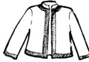
5. Női friskó vagy friskóujjas