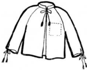
3. Férfi frizis vagy friskó mellévarrott ujjal