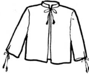
4. Férfi frizis vagy friskó bevarrott ujjal