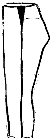
1. A cikkely alkalmazása a harisnyán

4. A posztóharisnya szárának felső felébe, az oldalvarrások közé varrt betoldás (M).