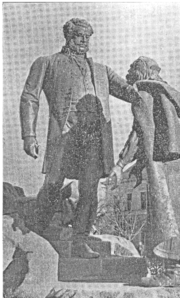
A Wesselényi-szobor, Fadrusz remekműve, most visszakerül Zilah főterére.

ben. Húsz év alatt teméntelen románból lett értelmiségi és nagyon sok középosztálybeli román szerzett európai látókört. A magyar földbirtokok gyökeres és kegyetlen szétosztása igen sok román parasztot földhöz juttatott; gazdasági és népjóléti szervezetek, főképpen pedig az a pénzügyi politika, hogy a mezőgazdasági beruházásra felvett kölcsönöket szinte leírták, – természetesen főképpen a magyar tőke terhére – pénzhez is juttatta őket. A román nép öntudatát nagyon emelte az, hogy az állam maga tulajdonképpen parasztállam; nincs számbavehető történelmi osztálya s most alakul ki a parasztságból egy friss középosztály; ez azonban még nem távolodott el a falutól. Végül természetes, hogy húsz esztendő zengő nacionalizmusa felébresztette és nagyra növelte a román nép nemzeti büszkeségét s lényéből kimosta