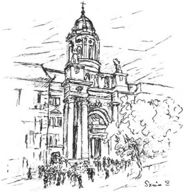
6. kép – Római katolikus templom (belvárosi)