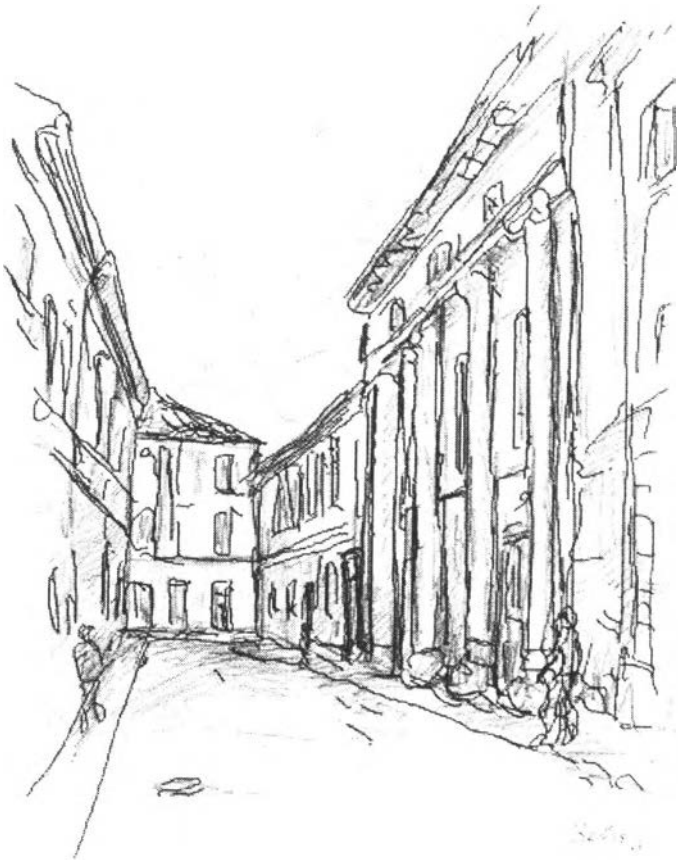
26. kép – A régi színház (1817)