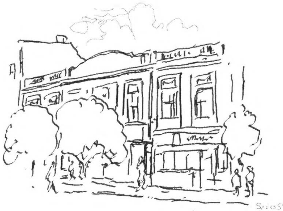
16. kép – A Czigler család háza