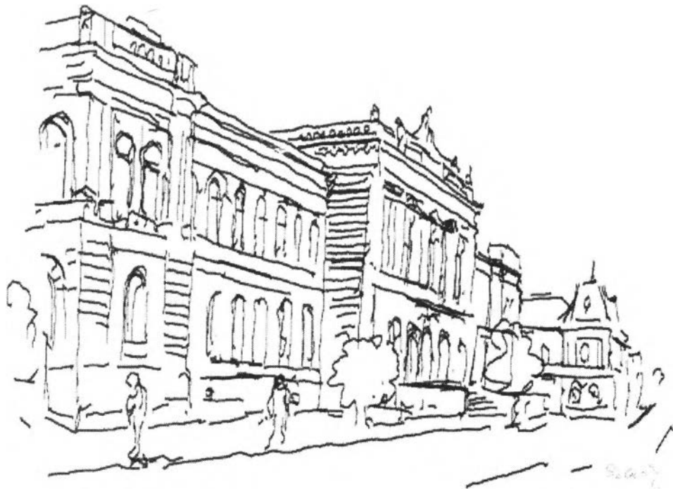
37. kép – Lyceum (Királyi Főreál – 1873)