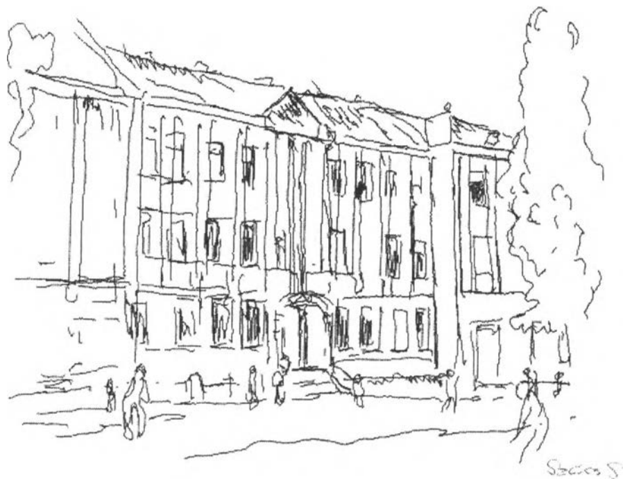
22. kép – A Csiky Gergely iskolacsoport (volt Katolikus Gimnázium)