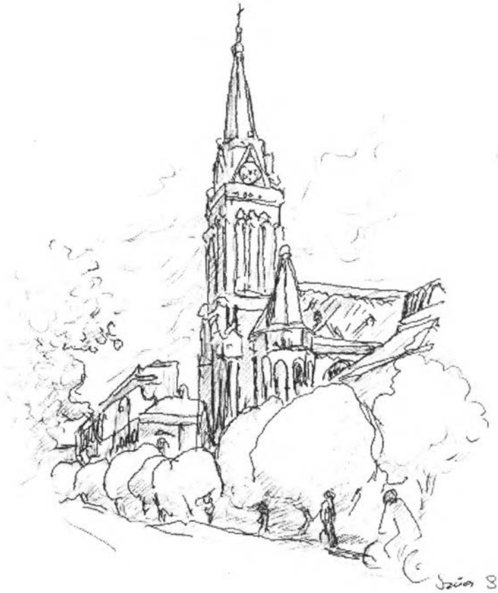
38. kép – A Vörös templom (evangélikus-lutheránus templom) 1906