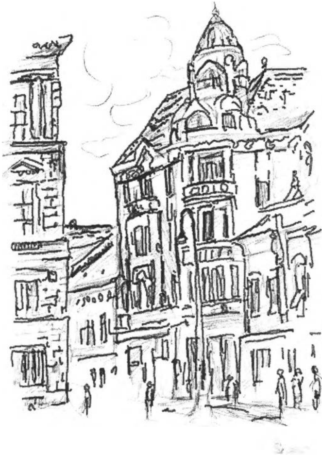
25. kép – A Bohus-palota