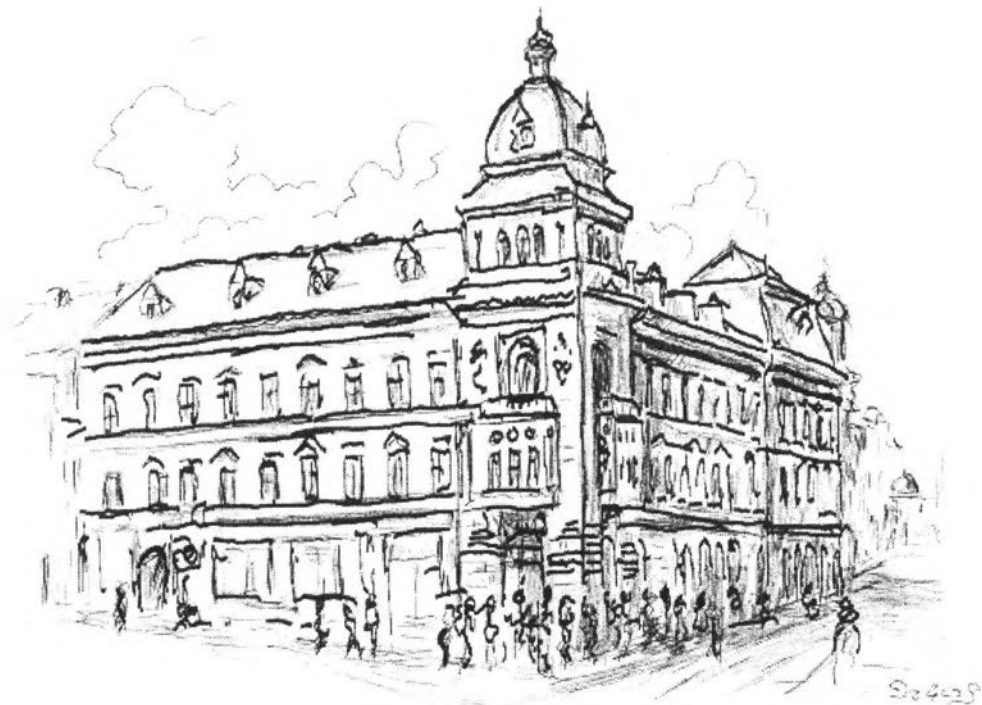
17. kép – A Neumann-palota