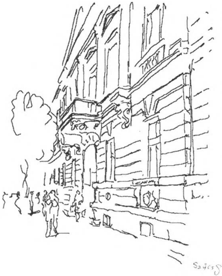
23. kép – Volt vármegyeház és járásbíróház