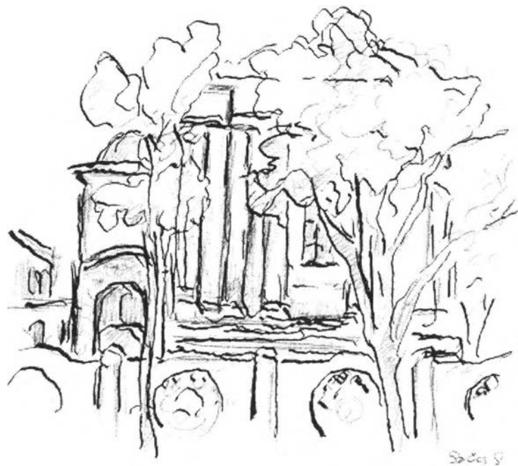
36. kép – Az Összetartás Szabadkőműves Páholy (1905)