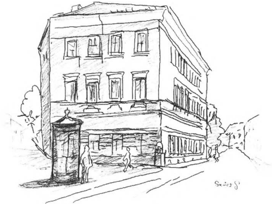
28. kép – A Winkler (lakat) ház és régi hirdetőoszlop