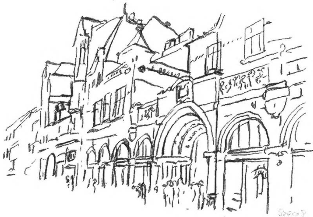
8. kép – Templom utca (Munkácsy M. emléktáblás ház)