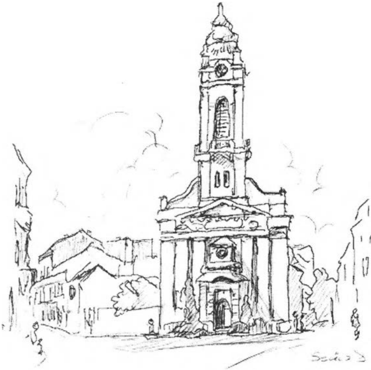
5. kép – Református templom (belvárosi)