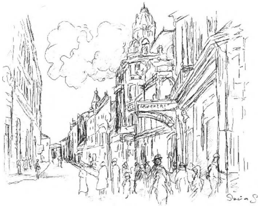
1. kép – A Fehér Kereszt Szálló (vendéglő)