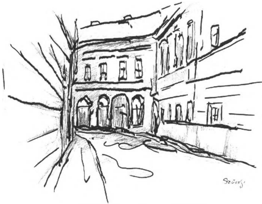
30. kép – Zsinagóga utca – jobbra Gárdonyi lakása