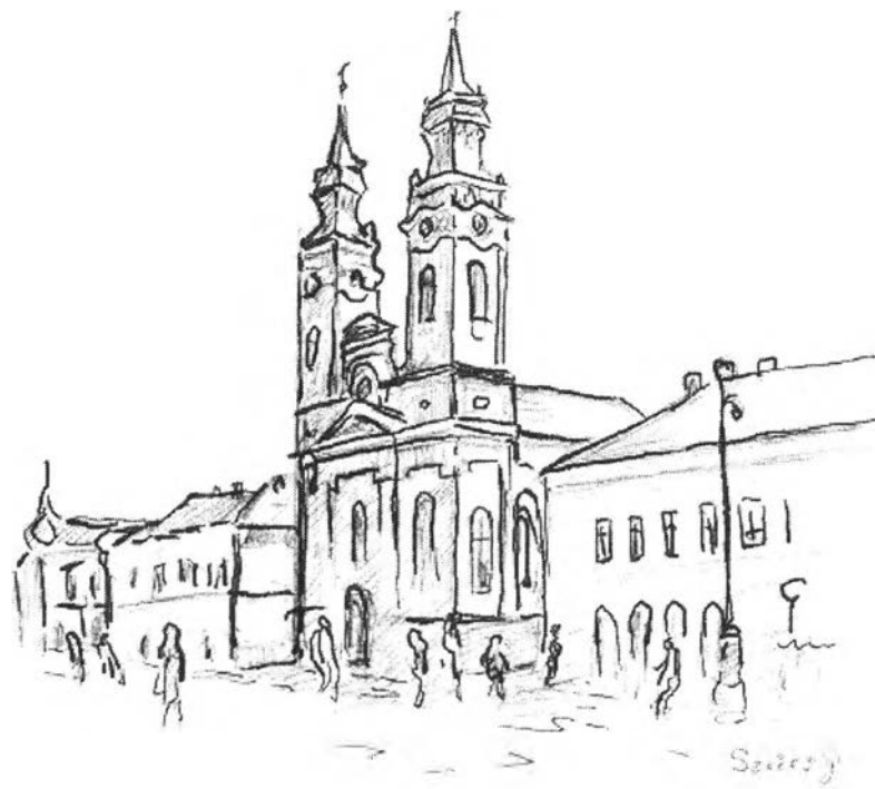
42. kép – Román ortodox katedrális (1861, Czigler)