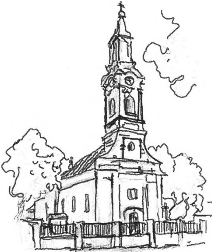
40. kép – A szerb templom (1690)