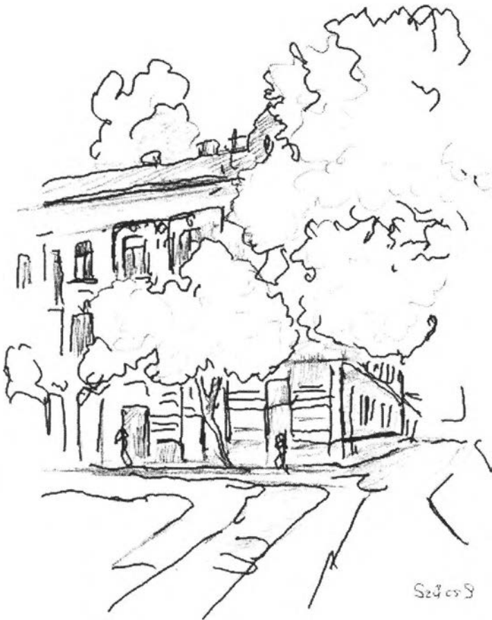
39. kép – Nagypiac (Asbóth Oszkár és Szántó György lakásai)