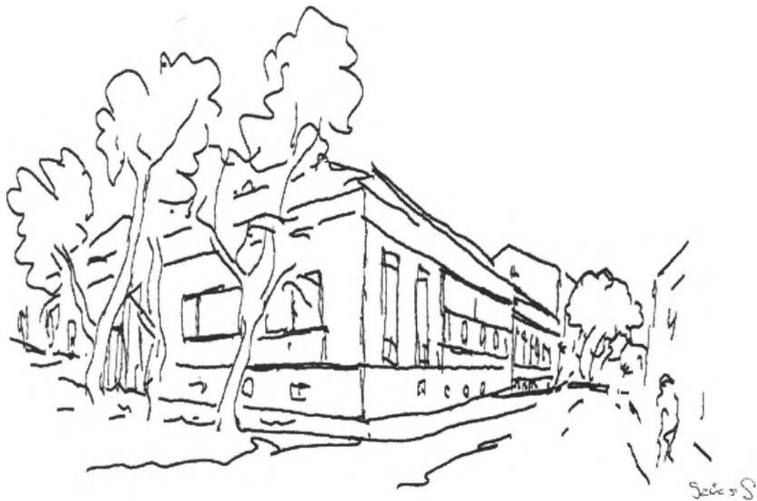
13. kép – A Desseanu-ház (Eminescu szálláshelye)