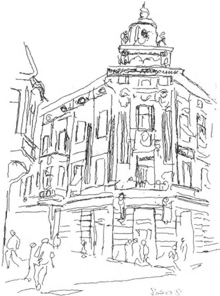
4. kép – A Földes-palota és gyógyszertár