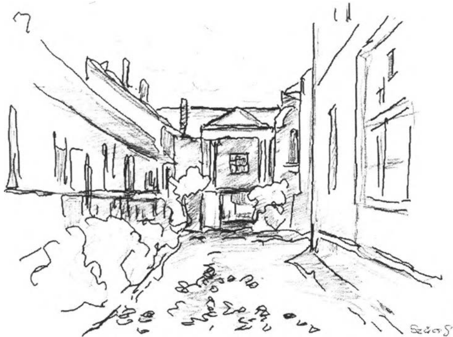
9. kép – A Templom utcai Török-ház (Zenede, Balla F. rajziskolája)