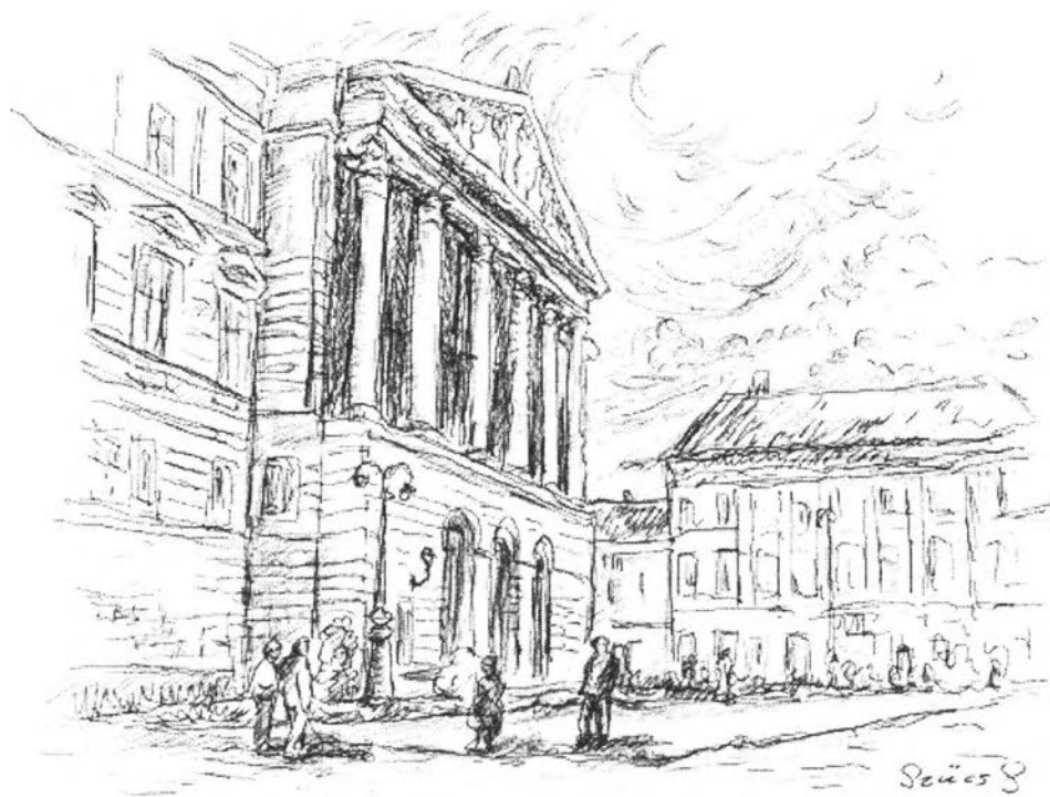
24. kép – Az új színház (1874)