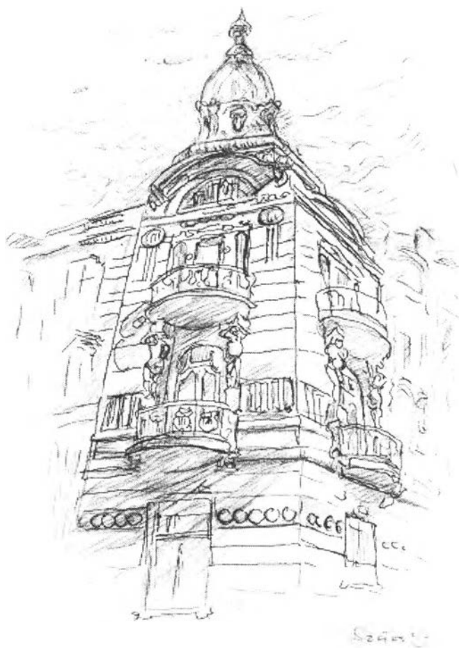
18. kép – A Szántay-palota