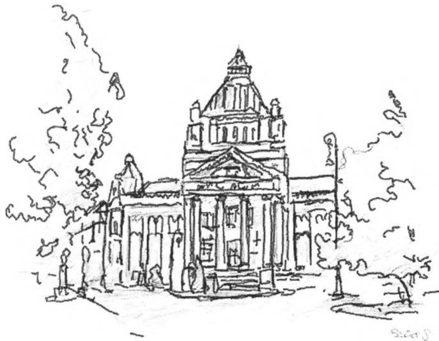
21. kép – A Kulturpalota