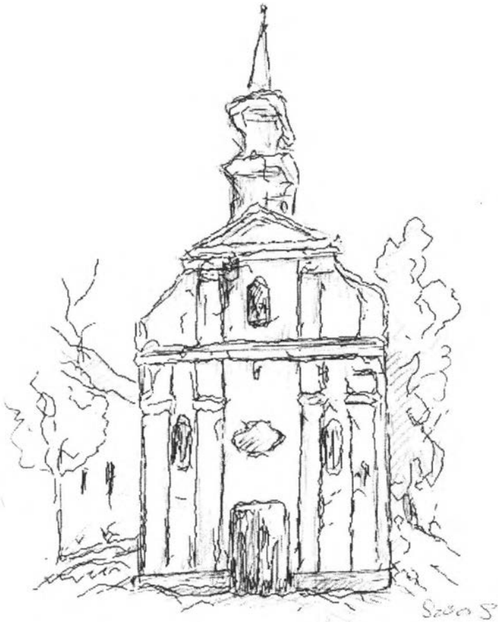
45. kép – A lebontott Flórián-kápolna