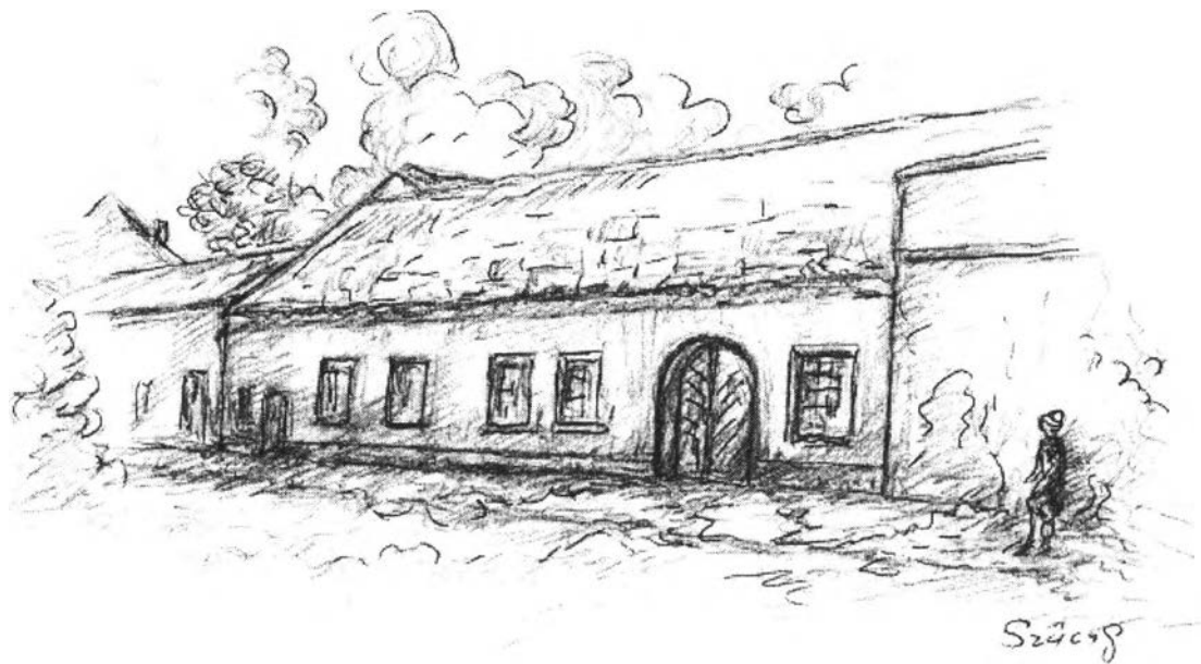
32. kép – Haltér – Török-ház (1680)