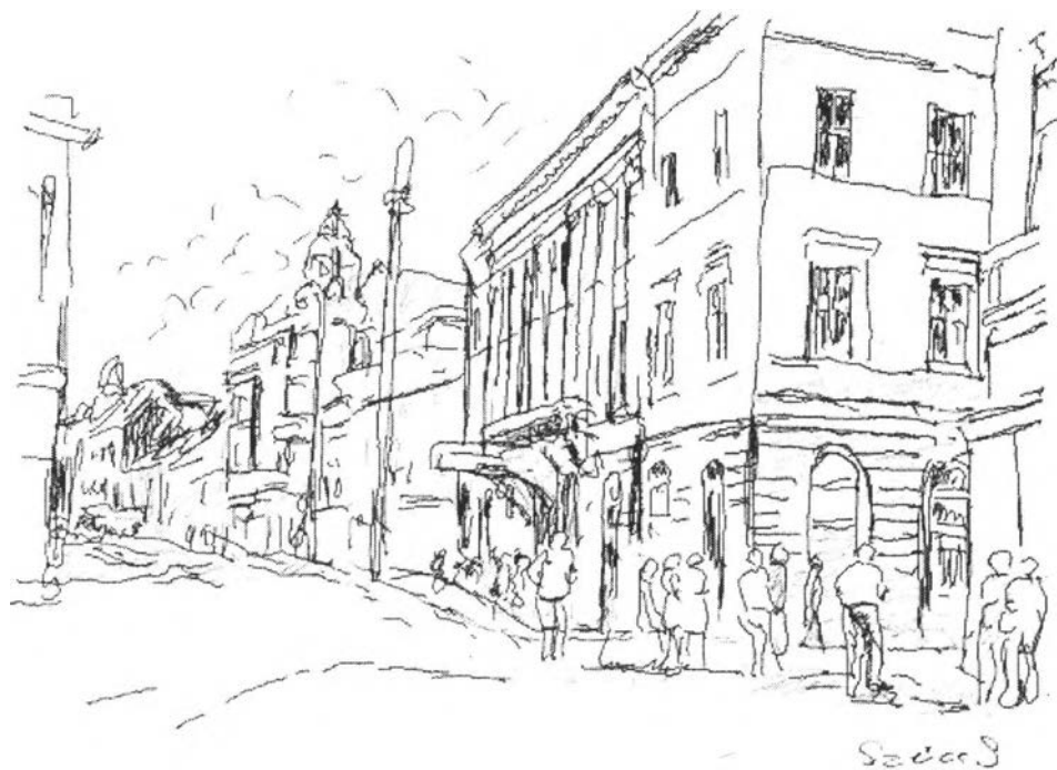
2. kép – A Fehér Kereszt télikertje (Deák F. utca)