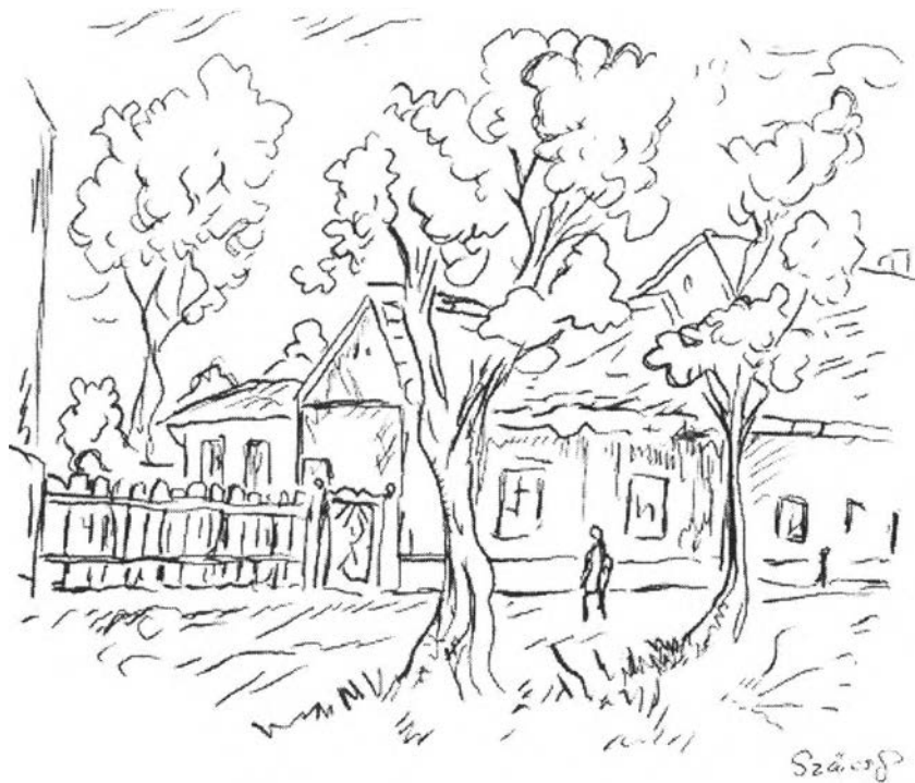
43. kép – Sarló utca 51. – Tóth Árpád szülőháza (eredeti rekonstrukció)