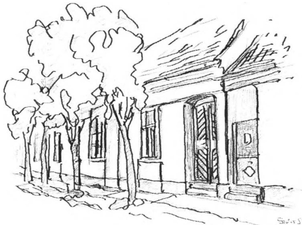
34. kép – A Damjanich-ház