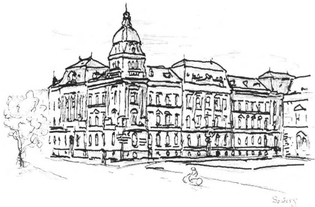
20. kép – A Csanádi-palota