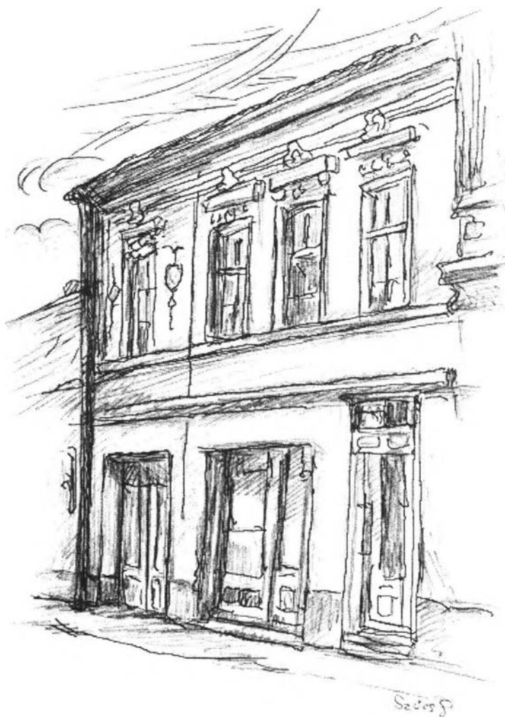
10. kép – Régi posta (Arad és Vidéke szerkesztősége)