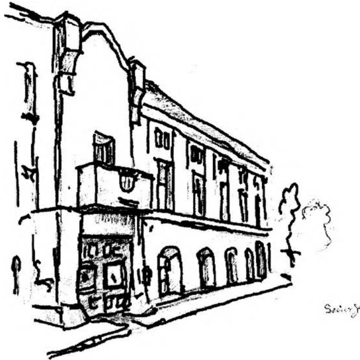
11. kép – Kölcsey-emlékház (1881-ben itt alakult az egyesület)