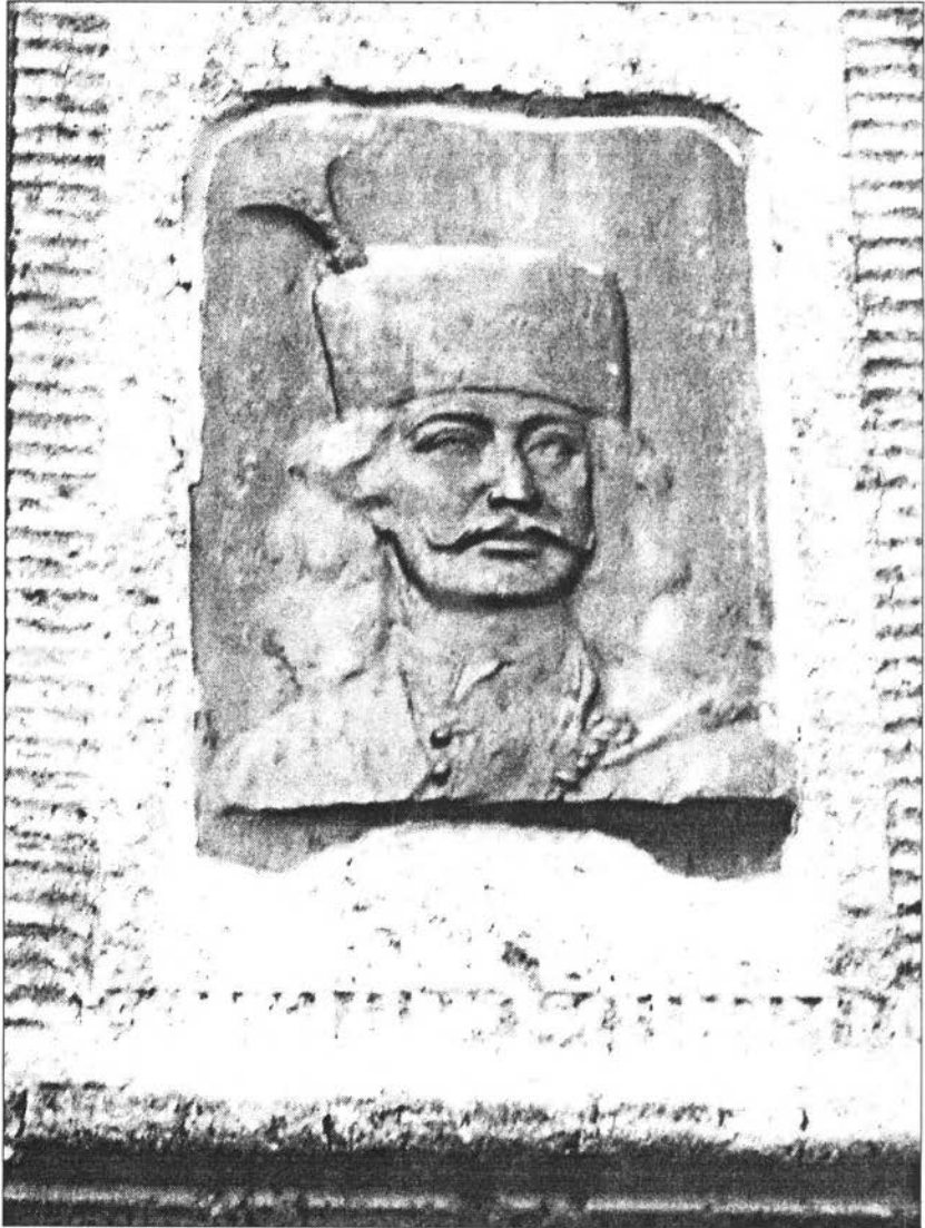
Rákóczi-relief a tiszabecsi obeliszken