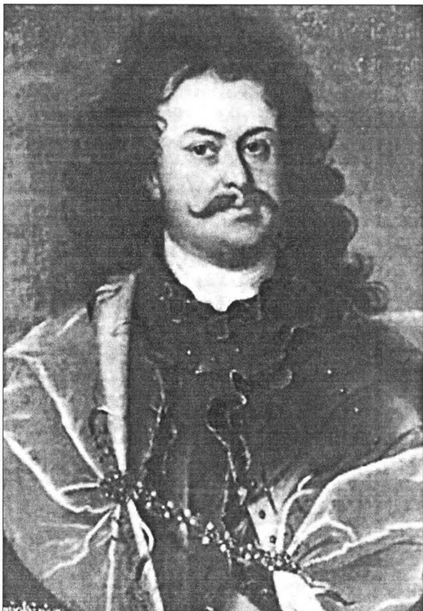
II. Rákóczi Ferenc