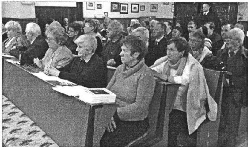
A záróülés hallgatói