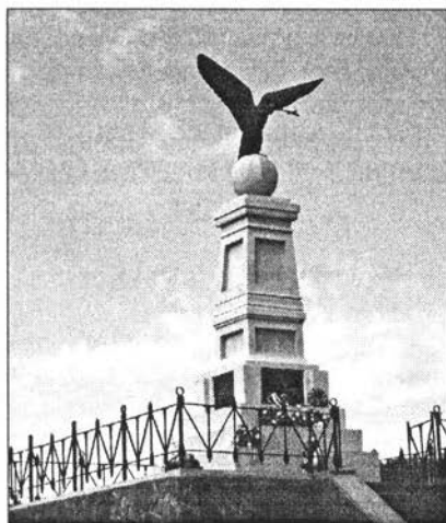
A tiszaujlaki emlékmű