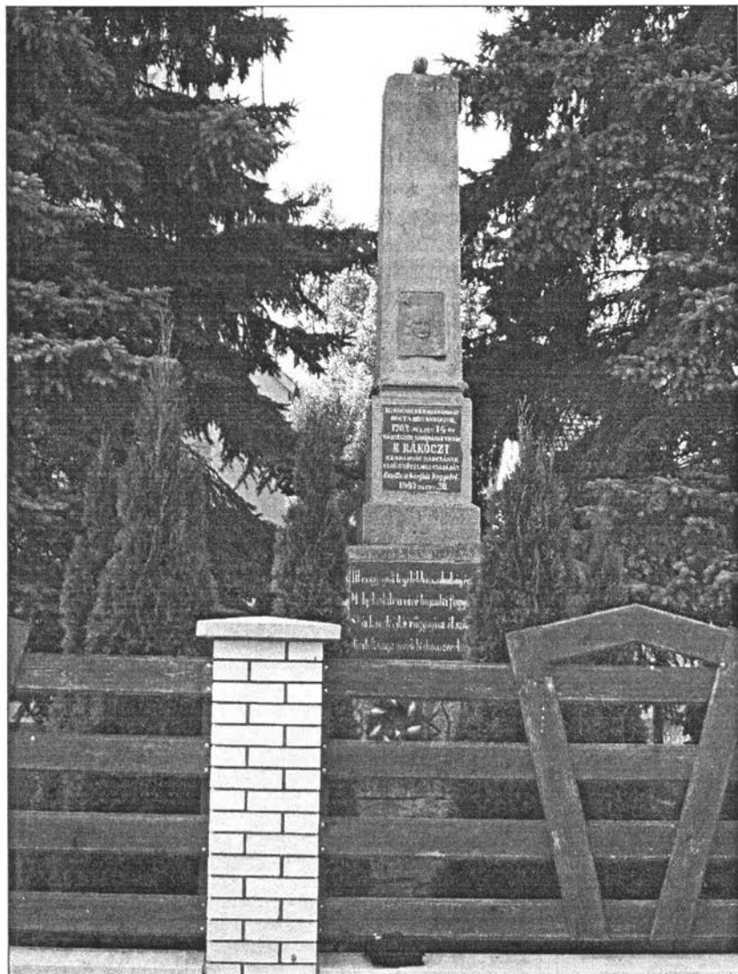
A tiszaujlaki emlékműből épült szovjet emlékoszlop