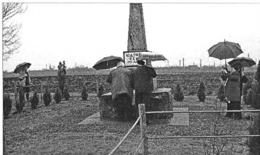
Koszorúzás a majtényi emlékműnél