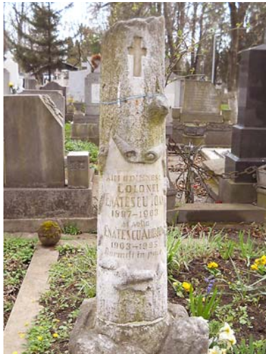
Az 1963-ban elhunyt Enătescu Ioan ezredes kettőtört mészkő oszlopa