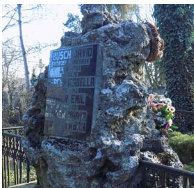
Busch Dávid (1846–1902)