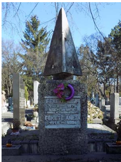
Fekete Iosif (1903–1979)