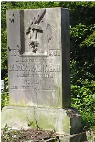
Böszörményi Emil (1890–1938)