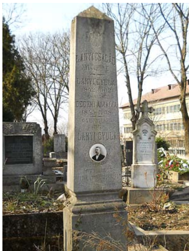
Az 1912-ben elhunyt Lányi Gyula emlékrét fényképe is őrzi a családi obeliszken