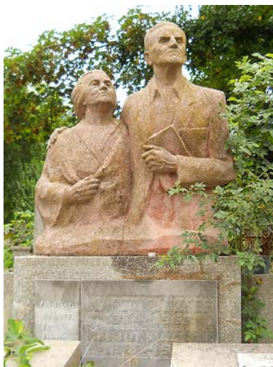
Egy pedagógus házaspár sírkövén ott áll hitvallásuk is: „Céłod legyen: dolgozz, tanulj, taníts!”