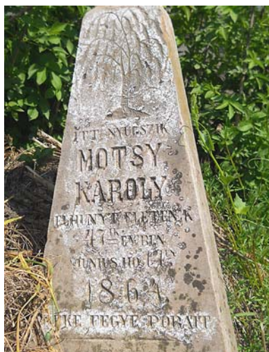
Az 1864-ben elhunyt Mótsy György megdőlt, rég gazdátlan sírkövén a „Béke fegye porait!” szavakkal zárul a felirat