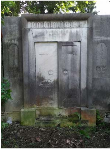
Adorján Ármin (1867–1938)