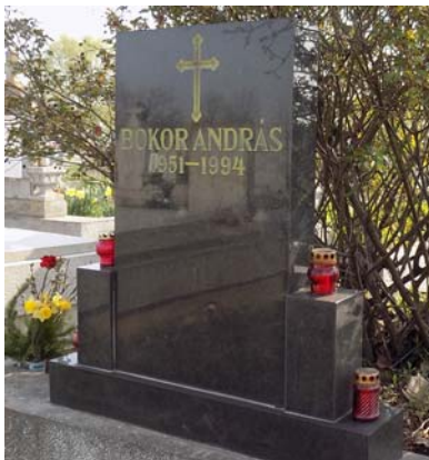
Bokor András (1951–1994)