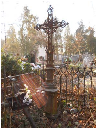
Öntöttvas kereszt, temetkezési kultúránk egyedülálló értéke