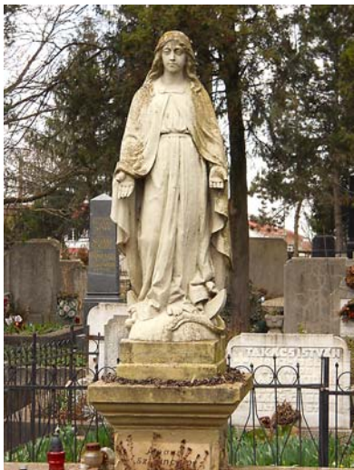
Mária-szobor a Páli Szent Vincéről nevezett Irgalmas Nővérek Immaculata Intézetének sírhelyén