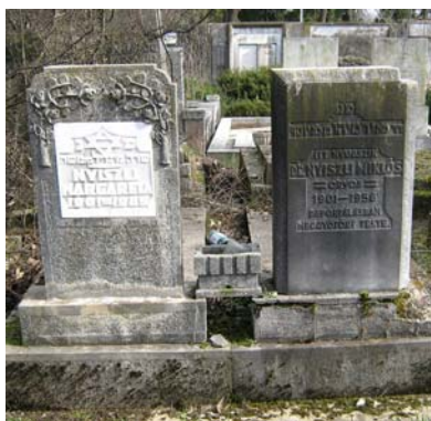
Dr. Nyiszli Miklós (1901-1956)