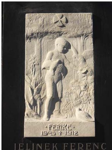
Galagbok és növények között ábrázolták a hétévesen elhunyt kislfiút