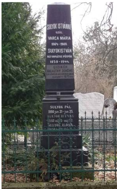
Sulyok István (1859–1944)