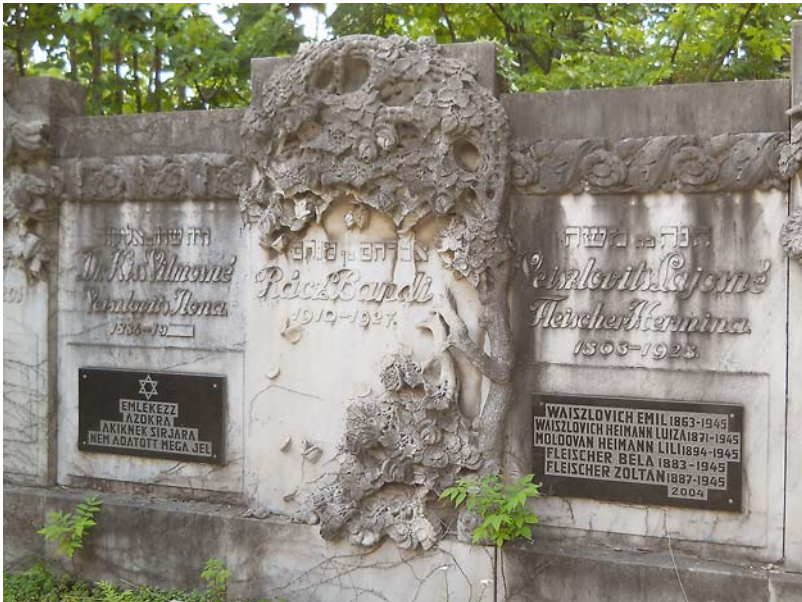
A Veiszlovits család sírhelye