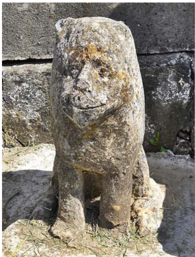
Az egyik sírhely előtt egy kutya megkopott és elnagyoltan faragott alakja vonja magára a figyelmet