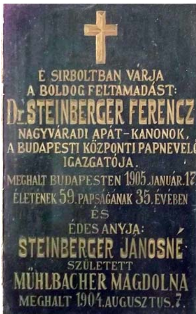
Steinberger Ferenc-emléktábla a kápolnában