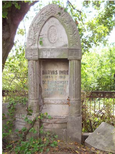
A Darvas család síremléke