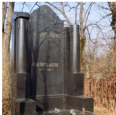
Berkovits Ferenc (1848–1912)