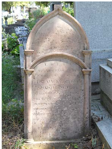
E pártatlan sírfelirat Szaniszló Eszternek állít emléket