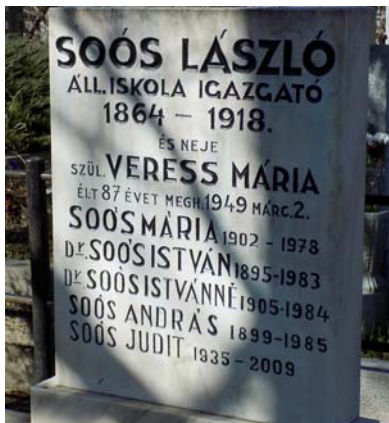
Soós István (1895–1983)