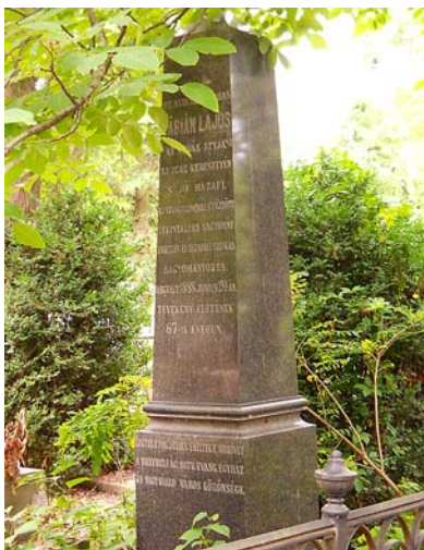
Fábián Lajos, „az árvák atyja, az igaz keresztény, s jó hazafi” síremléke