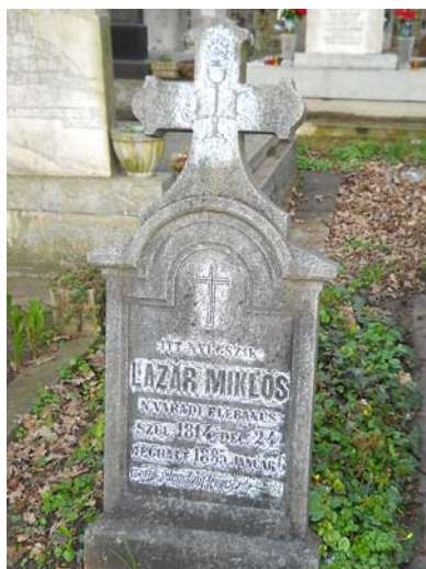
Egy 1885-ben elhunyt „plébános” sírkövén látható a kehelyszimbólum