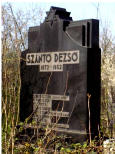
Szántó Dezső (1872–1932)