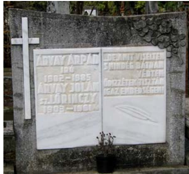
Árvay Árpád (1902–1985)