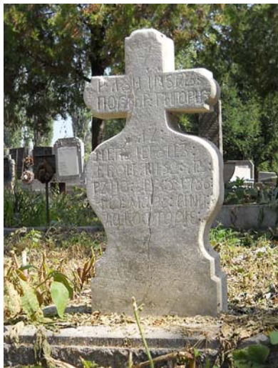
A temető legrégebbi sírköve - 1786-ból