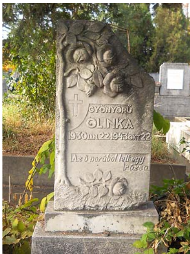
Egy 1943-ban készült sírkövön olvasható: „Az ő porából lett egy rózsza”