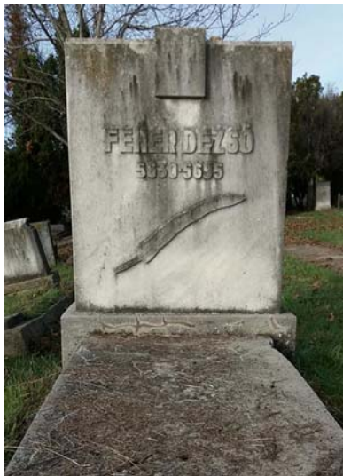
Fehér Dezső (1870–1935)