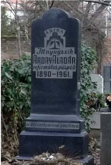
Arday Aladár (1890–1961)