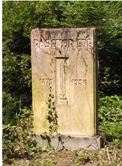
Pásztor Ede (1879–1936)