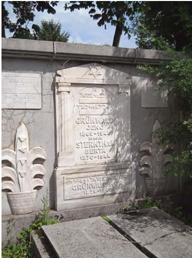
A Grünwald család síremléke