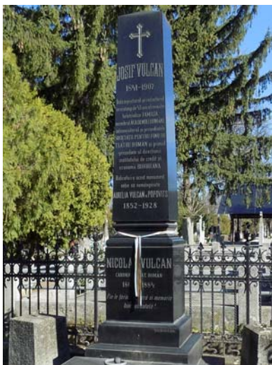
Iosif Vulcan (1841-1907)