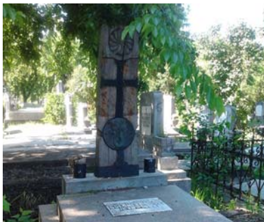
Bölöni Sándor (1939–1982)