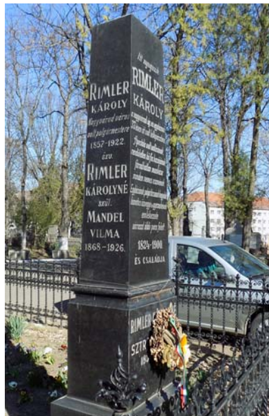
Rimler Károly (1857–1922)