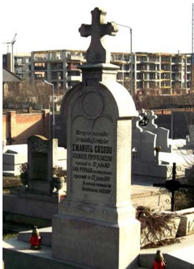
Gajdu Emanuil szülei