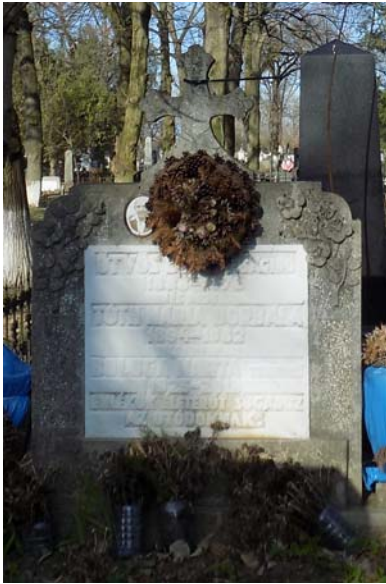
Ötvös Béla (1888–1970)