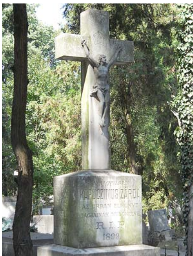
A kapucinusok sírhelyének 1899-ben állított feszülete