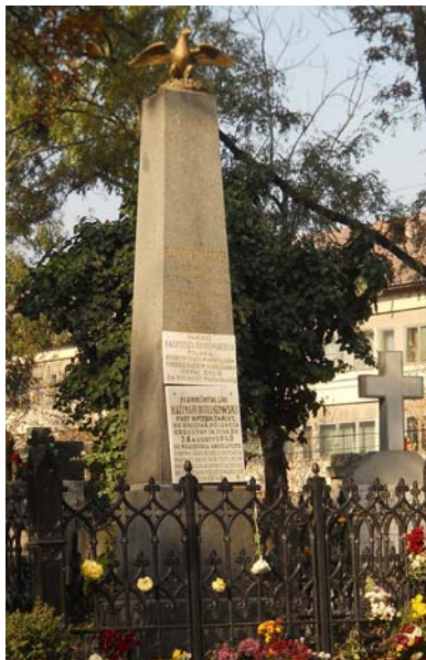
Rulikowski Kázmér (1814-1849)