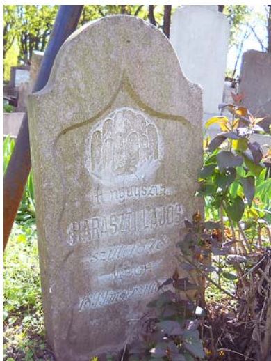
Az 1899-ben készült Haraszti-kő, amelyre a fűz szépen stilizált változata került