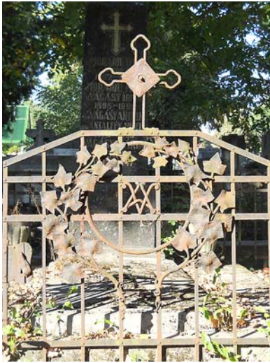
Olaszkoszorú egy sírkerítésen