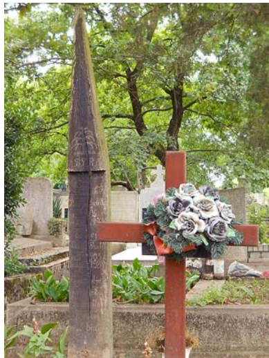
Csónak alakú fejfák