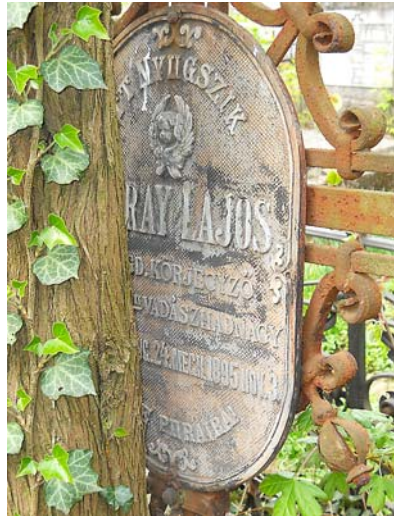
Tátray Lajos vadászhadnagy sírkeresztje