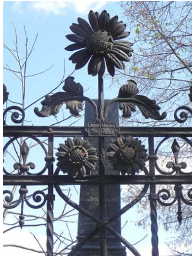
Lévai Márton műhelyében készült, szépen kidolgozott napraforgó