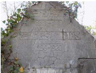
Rendes Vilmos (1856–1920)