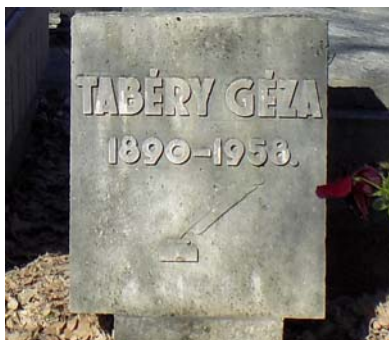
Tabéry Géza (1890–1958)