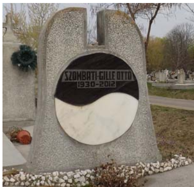
Szombati Gille Ottó (1930–2012)