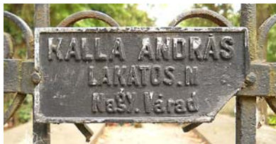
Korabeli műhelyek, mesterek cégjelei a kovácsoltvas sírkerítéseken