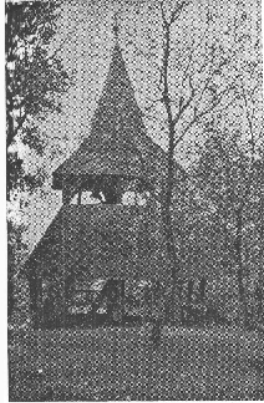
Magyarfűlpösi magyar fatorony. XVII–XVIII. század.