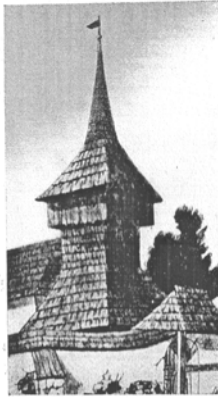
Az egykori magyarókercki magyar fatorony. 1690. Telegdy Árpád rajza. (Néprajzi Múzeum.)