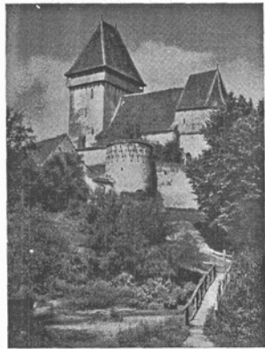
Szászivánfalvi szász templom.