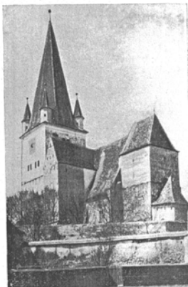
Nagydísznői szász templom.