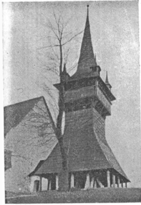
Az egykori magyarbikali magyar fatorony. XVII–XVIII. század.