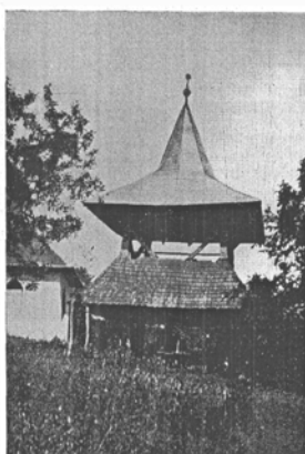
Krasznahorváti magyar fatorony. 1669 (?)