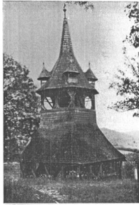
Mezőcsávasi magyar fatorony. 1570 (?)