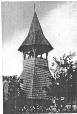
K. Sebestyén J. felőttele Kálnoki magyar fatorony. 1781.