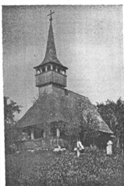
Farnosi román fatemplom.