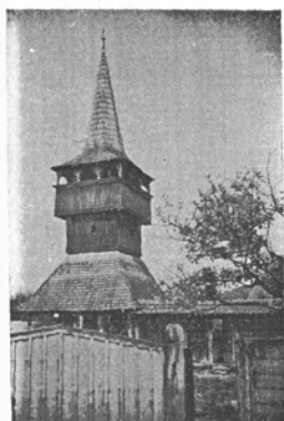
Farnosi magyar fatorony. XVIII. század.