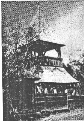
Fotófelvétel Pótkai magyar fatorony. XVII–XVIII. század.