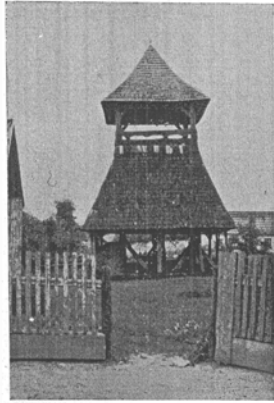
Magyarsülyei magyar fatorony. 1773.