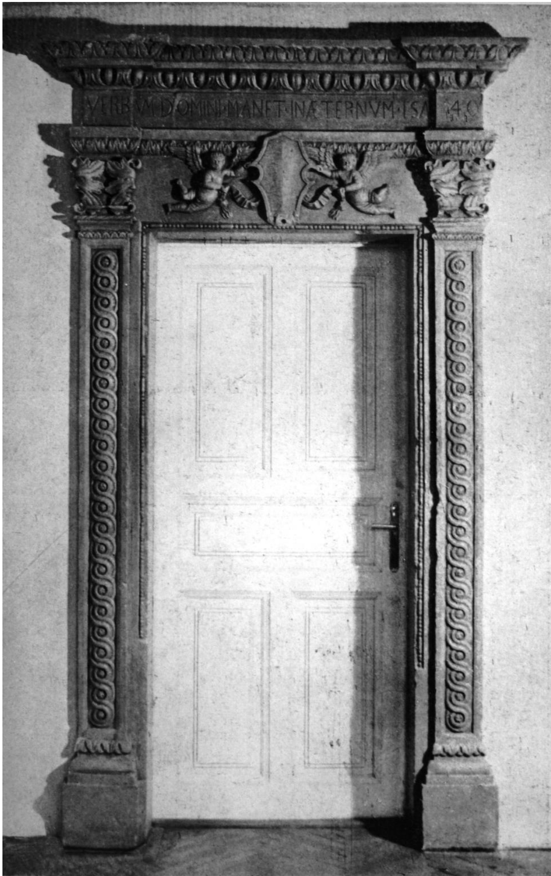
169. Kolozsvár. Mátyás király-tér 20. Ajtó az egyik emeleti szobában. 1541 körül.