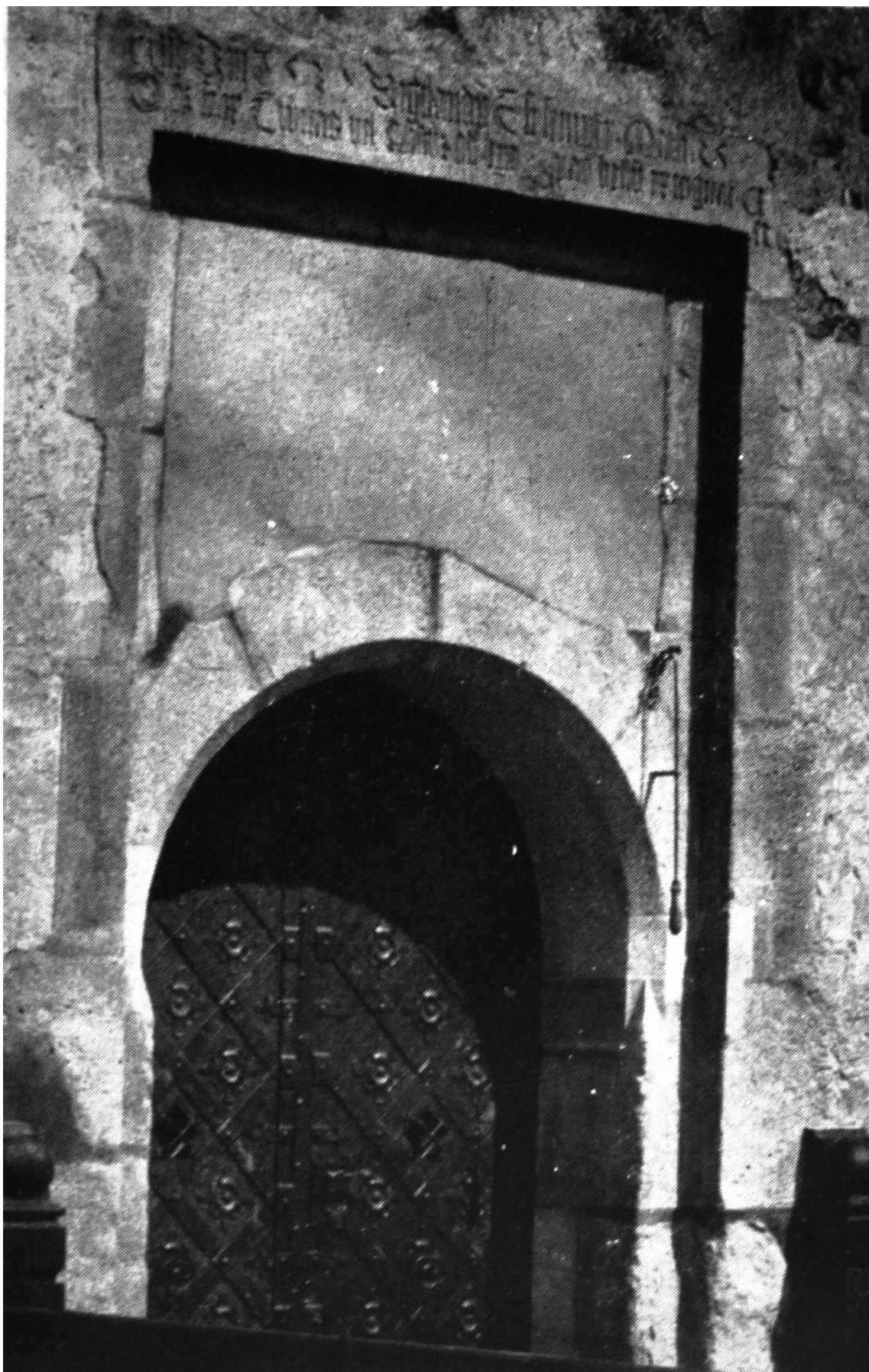
162. Marosvécs, vár. Főkapu. 1537.