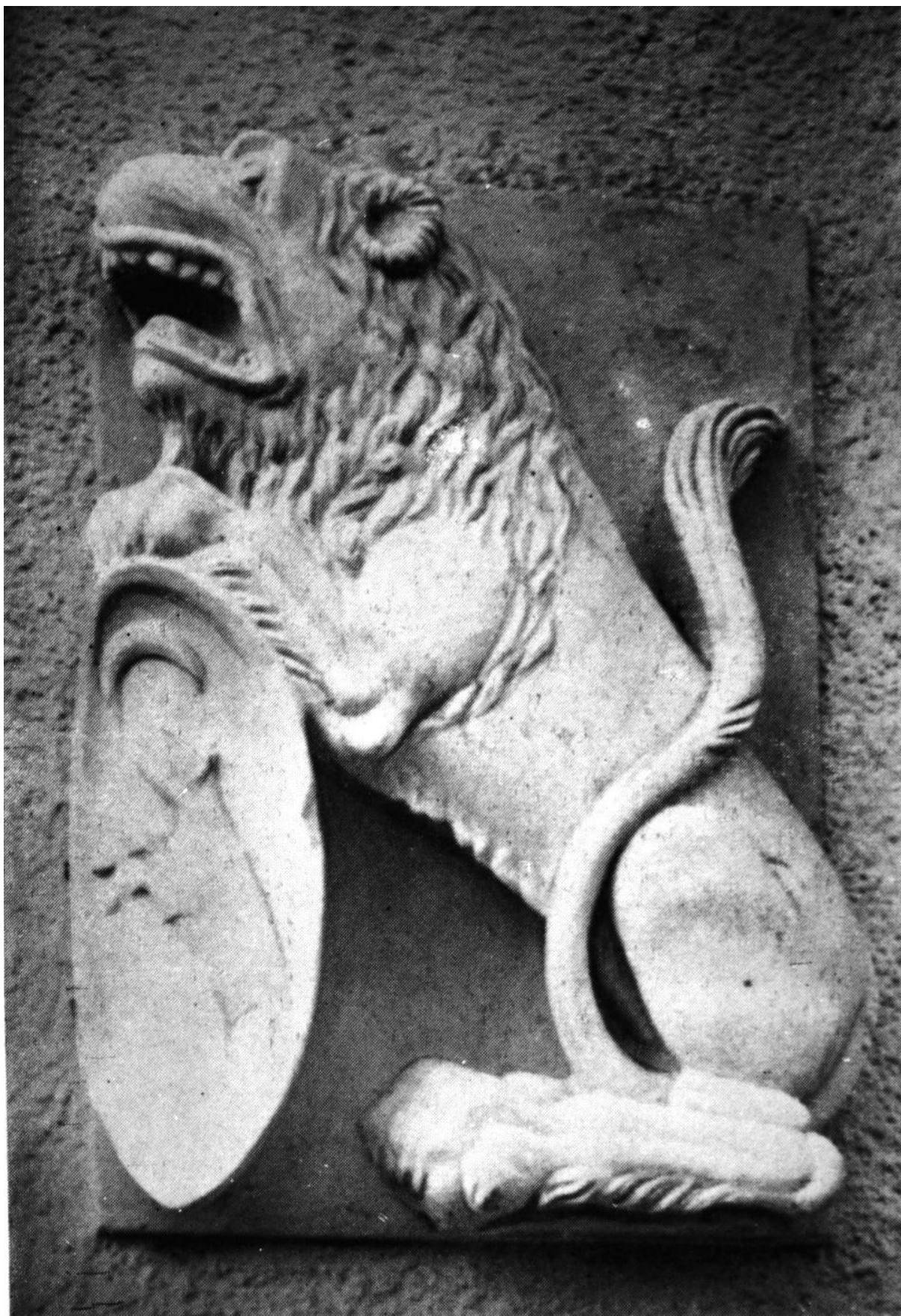
167. Szamosújvár, vár. Zápolyai János címere. 1540 körül.