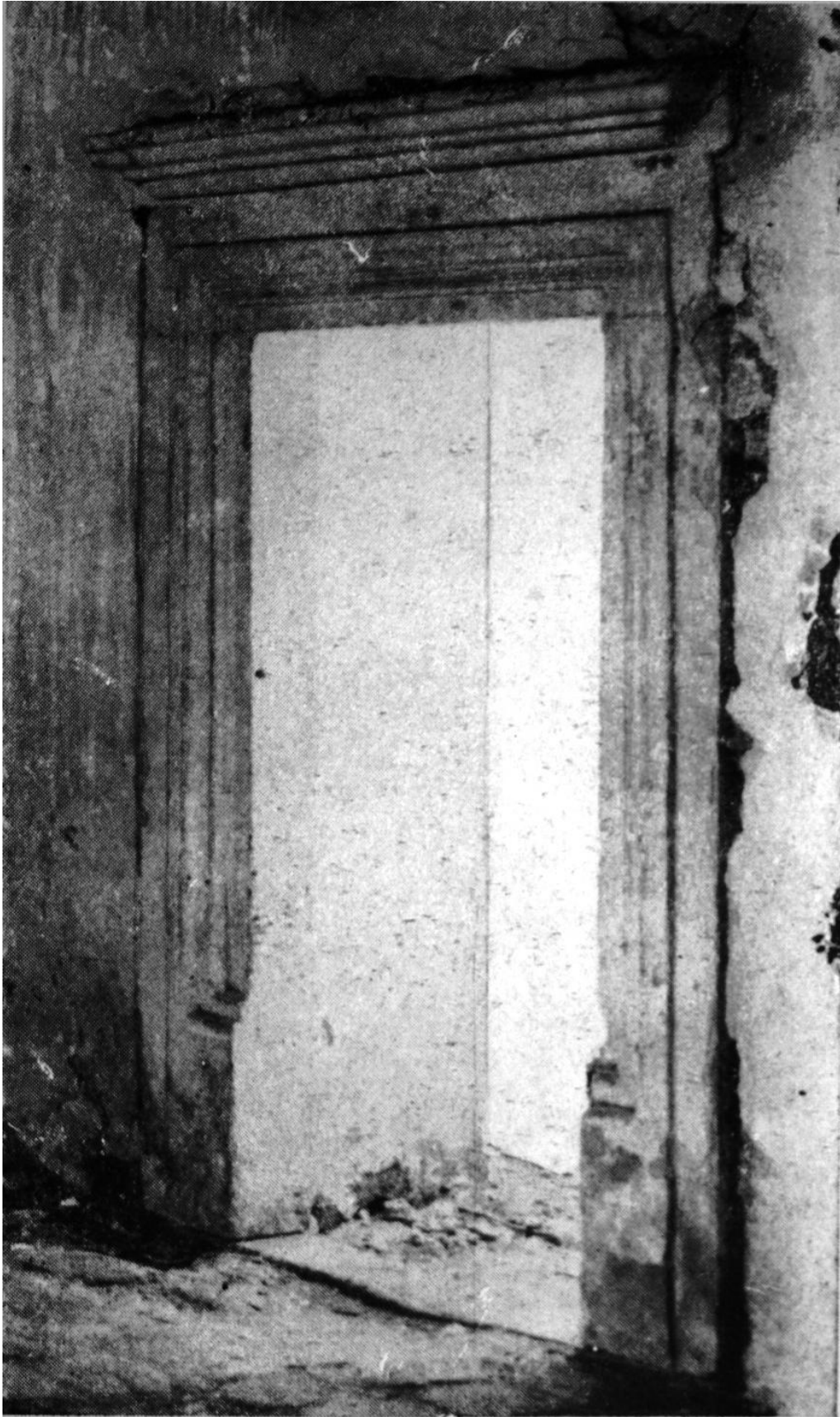
164. Marosújvár, felsőújvári r. k. templom. Sekrestyeajtó. XVI. század első fele.