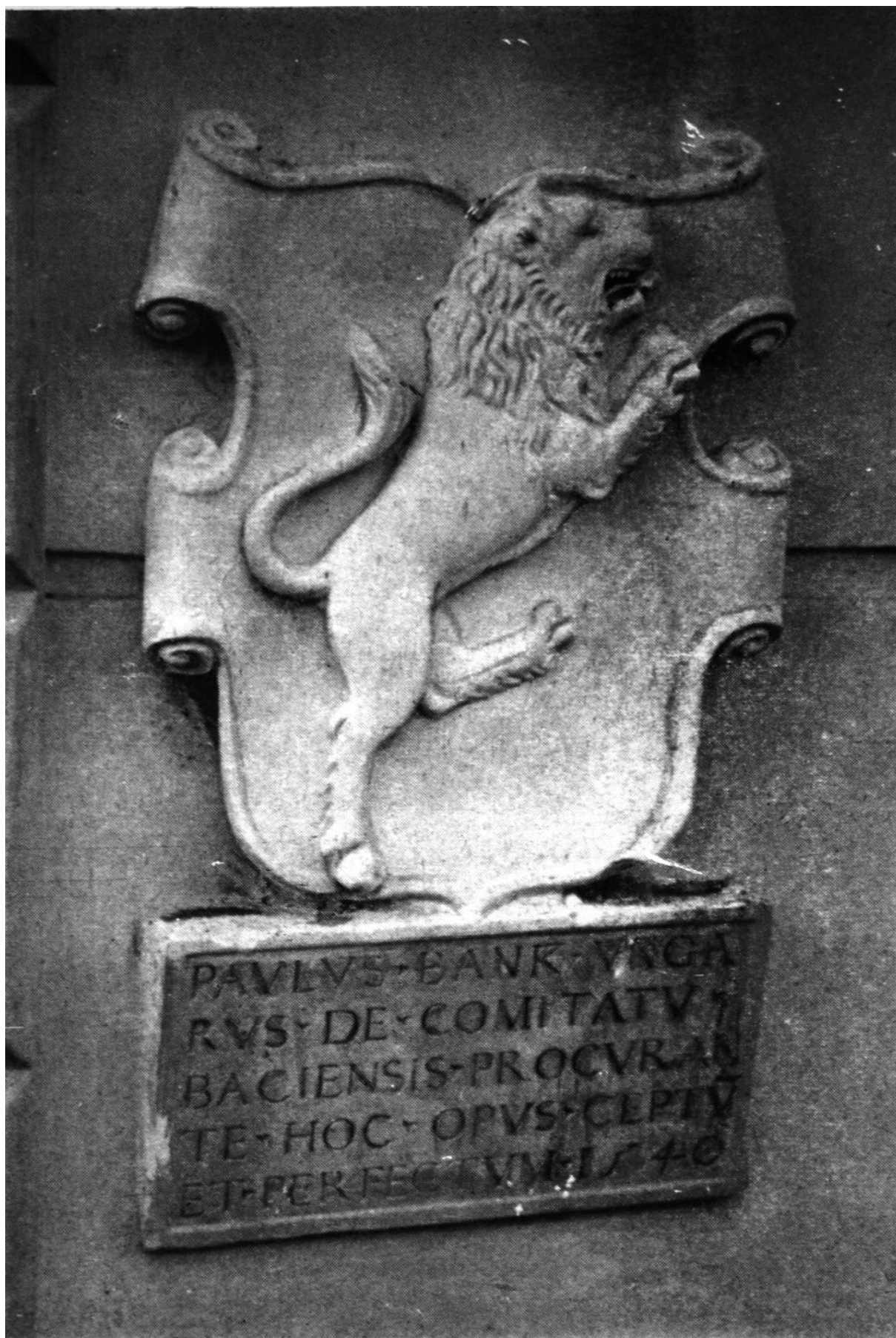
166. Szamosújvár, vár. Bánk Pál címere. 1540.