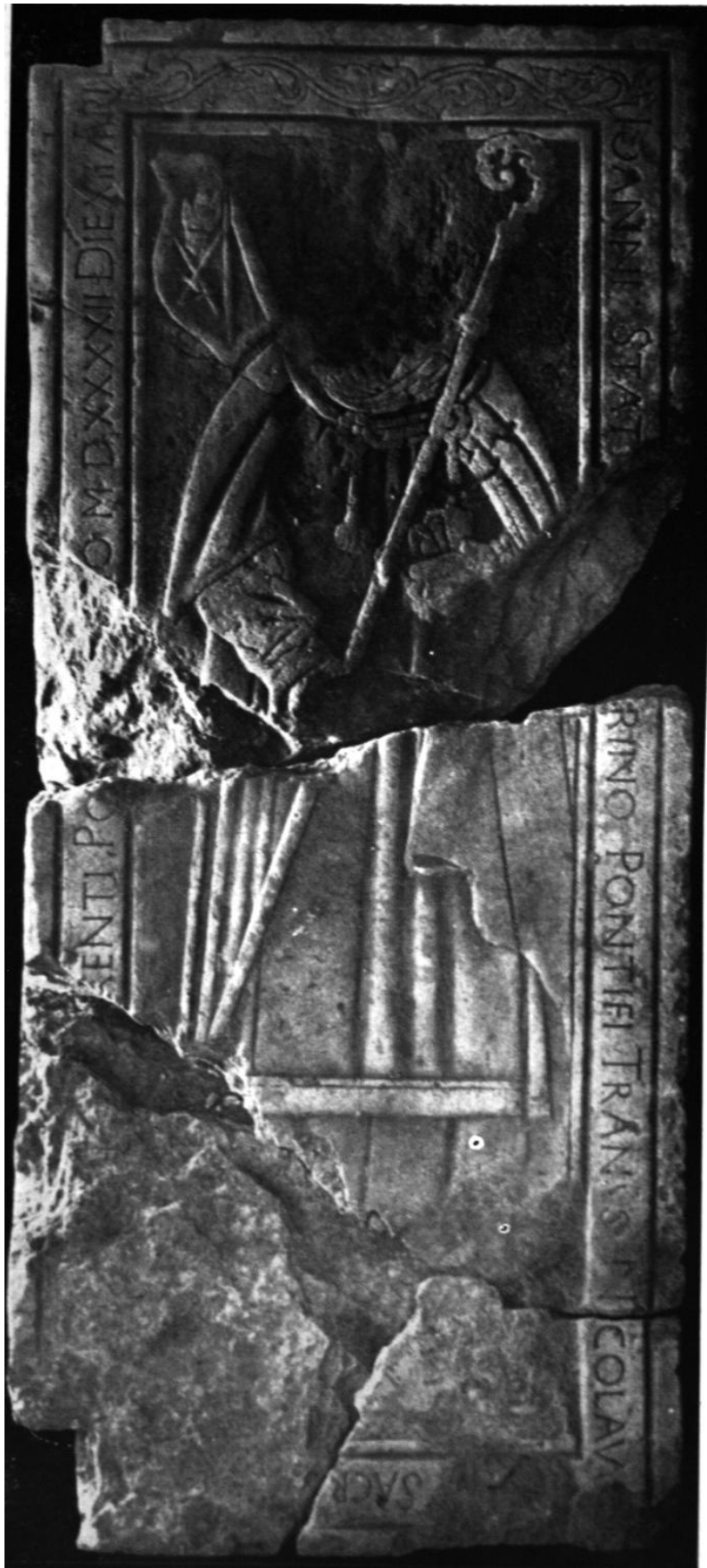
170. Gyulafehérvár, székesegyház. Statileo János püspök († 1542) sírköve.