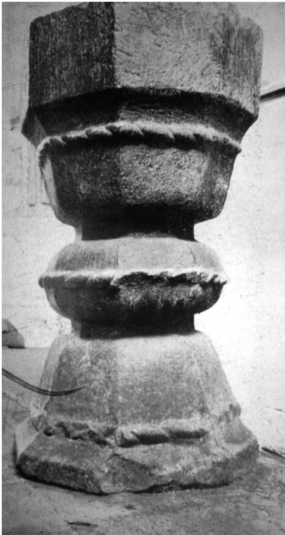
171. Nyujtód, r. k. templom. Keresztelőmedence, XVI. század első fele.