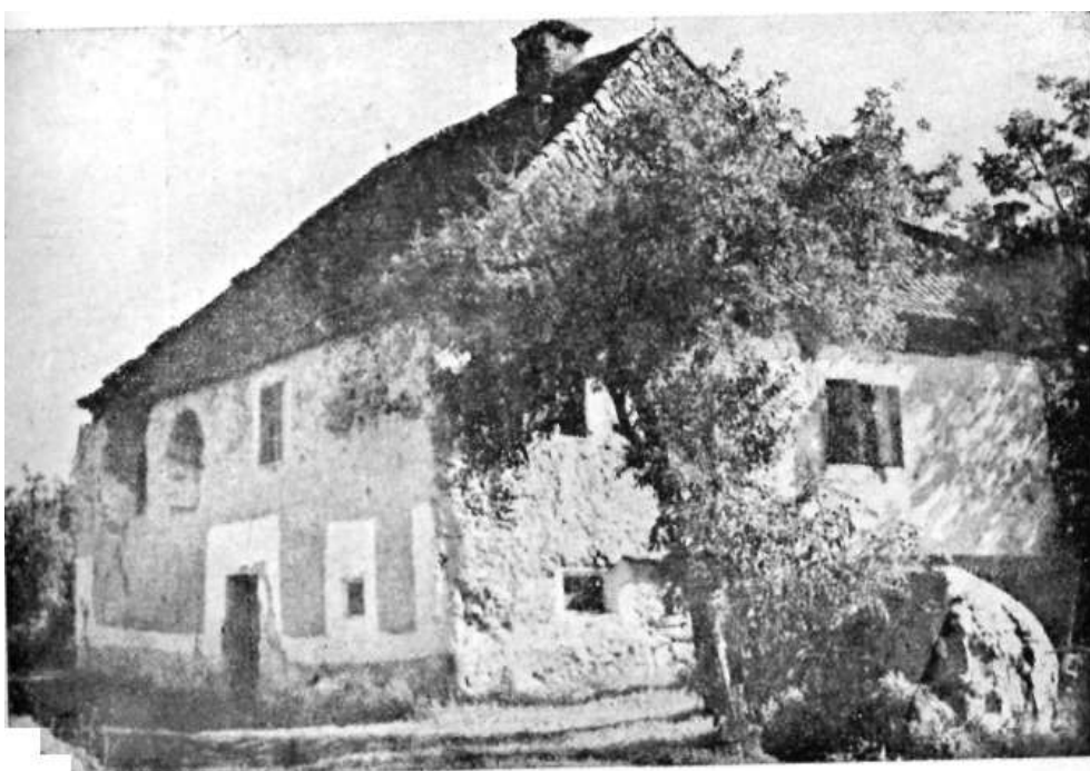
Az erdőfülei Boda-kúria a XVII. századból