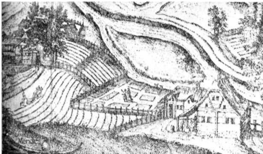
Major (bal oldalon) a hozzátartozó szántófölddel, kerttel és malommal a XVII. században Részlet Houfnaglius György Nagyváradról készített rézmetszetéből

Az ilyen illatszerek közül legelterjedtebb volt a rózsavíz, amellyel evés előtt kezüket bedörzsölték. Ide tartoztak az olajok, amelyeket a haj illatosítására és zsírosítására (mandula, menta, viola, szekfű, liliom, szerecsen-olaj), továbbá szépítőszerek (narancs-, citromháj-, rozmarin-, rózsaszíromolaj) használtak. 21 Az illatszerek készítésével természetesen a nők foglalkoztak. Ennek jeléül például az érlelő üvegek és az érő illatszerek helye Szentpéteren a leányok szobájával összefüggésben állott.