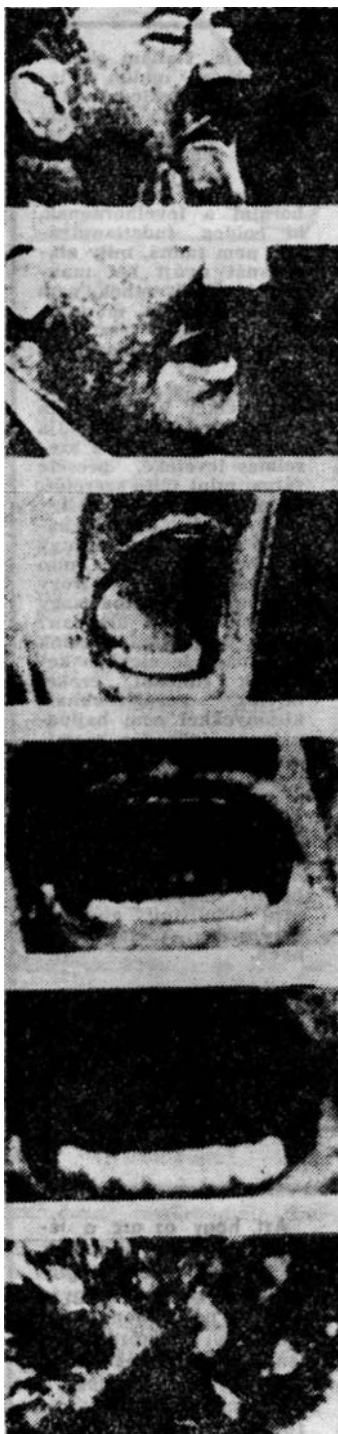
Filmkockák korabeli filmből

együtt főleg a társadalmi nyilvánosság szerkezetét változtatja meg, elsősorban azért, hogy megszünteti annak információs tagoltságát.