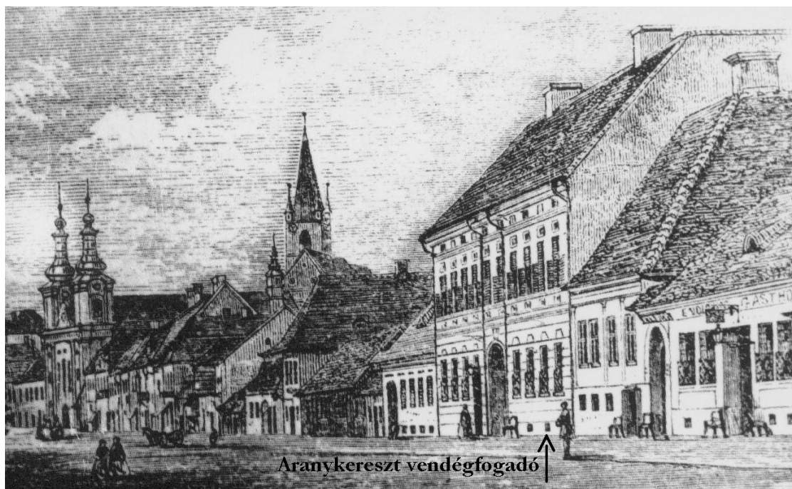
3. ábra: Aranykereszt vendégfogadó