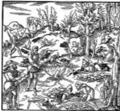
Felszíni bányászat (XVI. század)

Annál többet hallunk a „havas torkában” épült, a Hargita keleti oldalán fejedelmi tulajdonban lévő csikmadarasi vashámorról, illetve sokféle létesítményéről (fa-, faszén- és vaskötartó csűr, ércpörkölő, olvasztók, istálló és fűrészma-