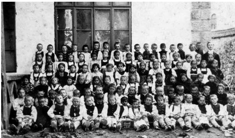
A Római Katolikus Népiskola I. osztálya (1912)