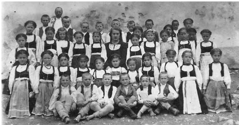
A Római Katolikus Népiskola egyik osztálya (1940-es évek)