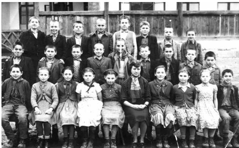
Az államosított Római Katolikus Népiskola egyik osztálya (1950-es évek)