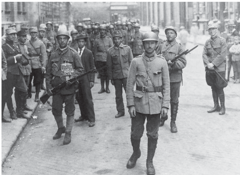
Román csapatok Pesten

A Károlyi Mihály, majd a Berinkey Dénes vezette magyar kormányon belül több miniszter, így például Jászi Oszkár vagy Búza Barna, már 1918 decemberében sürgették a pacifista magatartással való szakítást. A békekonferencia döntéseinek kivárására épülő stratégia megbukott, hiszen az ország területének nagyobbik részét 1918 végére