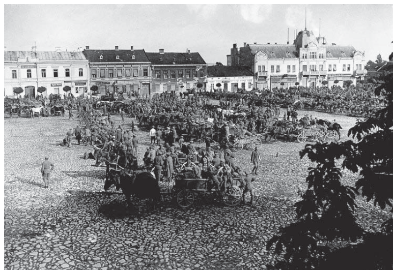
A magyar Vörös Hadsereg alakulatai Léván

1919. február 3. Vavro Šrobár teljhatalmú szlovák miniszter Zsolnáról Pozsonyba helyezte át Szlovákia új közigazgatási központját.