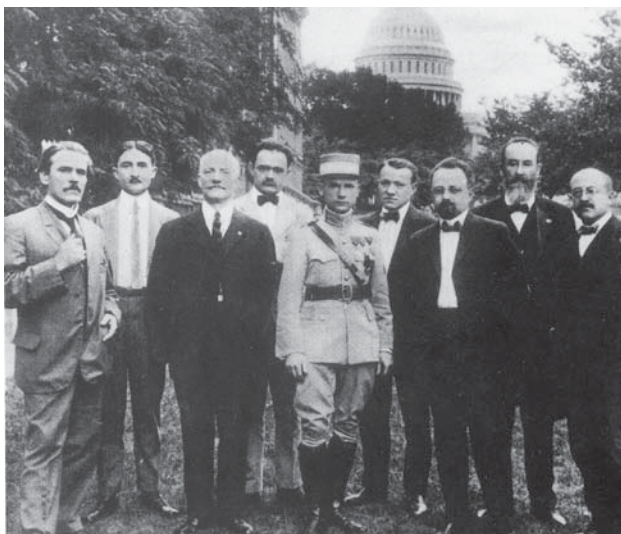
Milan Rastislav Štefánik csehszlovák hadügyminiszter amerikai cseh és szlovák szervezetek képviselőivel Washingtonban. 1919. július

Károlyi Mihály: Az ország integritásának védelméről. Beszéd a székely katonákhoz Szatmáron. 1919. március 2. In: Károlyi Mihály: Az új Magyarországról. Válogatott írások és beszédek 1908–1919. Vál., szerk. és jegyzetek: Litván György. Budapest, 1968. 293–294.