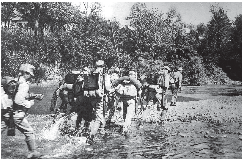
Az Osztrák-Magyar Monarchia hadseregének katonái az isonzoí fronton

Az antant hatalmak az 1915., illetve az 1916. évi londoni és bukaresti titkos szerződésekkel az antant oldalára állították az addig semleges Olaszországot és Romániát. Utóbbi az 1916. évi bukaresti szerződésben jogot nyert egész Erdélyre, Bánságra, a partiumi és a Tiszáig terjedő kelet-magyarországi területekre, amennyiben az antant oldalán hadba lép és nem köt különbékét. A londoni, párizsi csehszlovák, délszláv emigráció sikeres politikai, propaganda és katonai szervezői munkái,