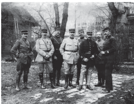
A Vix-misszió tagjai, jobbról a harmadik Vix alvezetés

Magyar értelmiségiek felhívása. Idézi: József Farkas: Álmok és tények . Argumentum, Budapest, 2001. 39–42.