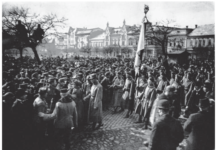
A székely hadosztály alakulatai Szatmárnémetiben

A Nemzetiségi Minisztérium rövid ideig felkarolta az Önálló Székely Köztársaság megteremtését célzó mozgalmakat is, a Benedek Elek, Györffy Gyula, Jancsó Benedek és Nagy Vilmos vezette budapestiek, és az erdélyiek (Bánffy Miklós, Bethlen István, Lóczy Lajos, Teleki Pál, Ugron Gábor) vezette másik Székely Nemzeti Tanácsot. A sikertelen aradi tárgyalások és a románok előrenyomulása után a Maros vonalától nyugatra és északra eső területek megmentése vált az elsődleges erdélyi célkitűzéssé. Ennek megfelelően a november 28-i marosvásárhelyi székely