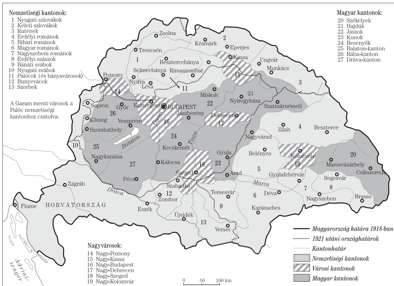
Jászi Oszkár terve Magyarország kantonizációjára

többségű területeken komolyabb ellenállás kifejtésére lehetett volna képes.