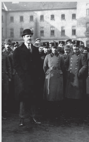
Károlyi Mihály az 1. gyalogezred katonái közt